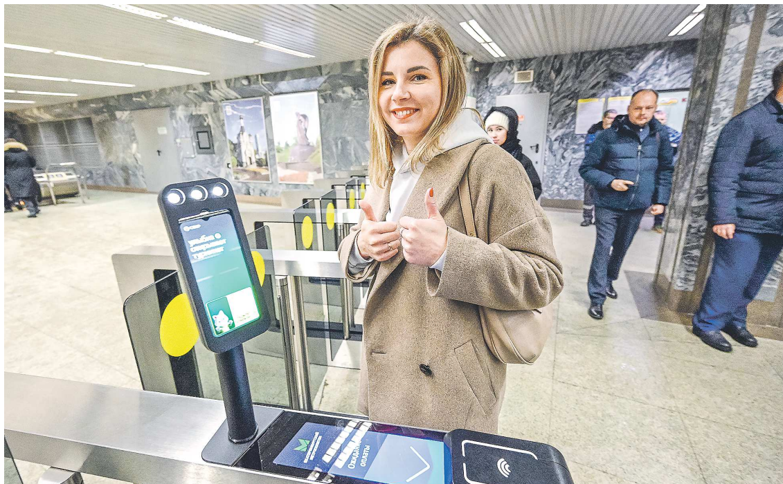
Сейчас услуга доступна только клиентам Сбера, но уже к концу года оплатить проезд улыбкой смогут и клиенты других банков