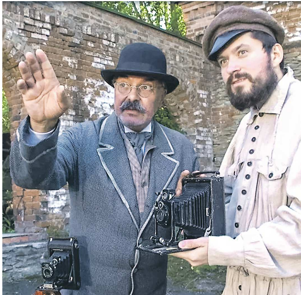
Кадр из фильма программы Недели уральского кино – картины «Дмитрий Соломирский. История меценатов России» режиссеров Юрия Дёмина и Марины Казниной, кинокомпания «Екатеринбург-фильм»