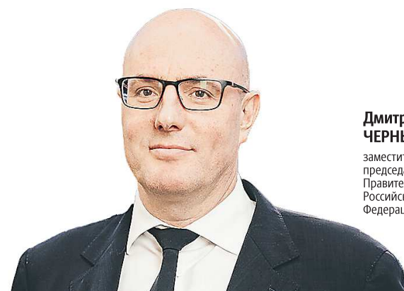
Дмитрий ЧЕРНЫШЕНКО, заместитель председателя Правительства Российской Федерации

« Всероссийская спартакиада станет крупнейшим спортивным мероприятием в 2024 году. По поручению Президента Владимира Путина Правительство России уделяет большое внимание развитию спортивной инфраструктуры в субъектах как для массового спорта, так и для крупных спорткомплексов в сфере спорта высоких достижений.