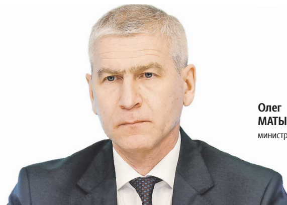
Олег МАТЫЦИН, министр спорта РФ

« Всероссийская спартакиада станет крупнейшим спортивным мероприятием в 2024 году. По поручению Президента Владимира Путина Правительство России уделяет большое внимание развитию спортивной инфраструктуры в субъектах как для массового спорта, так и для крупных спорткомплексов в сфере спорта высоких достижений.