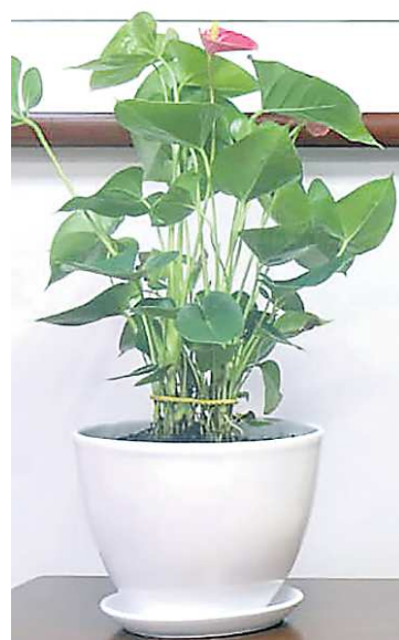
ГЕНЕРАЛЬНОЕ КОНСУЛЬСТВО КНР В Г. ЕКАТЕРИНБУРГЕ / Р.