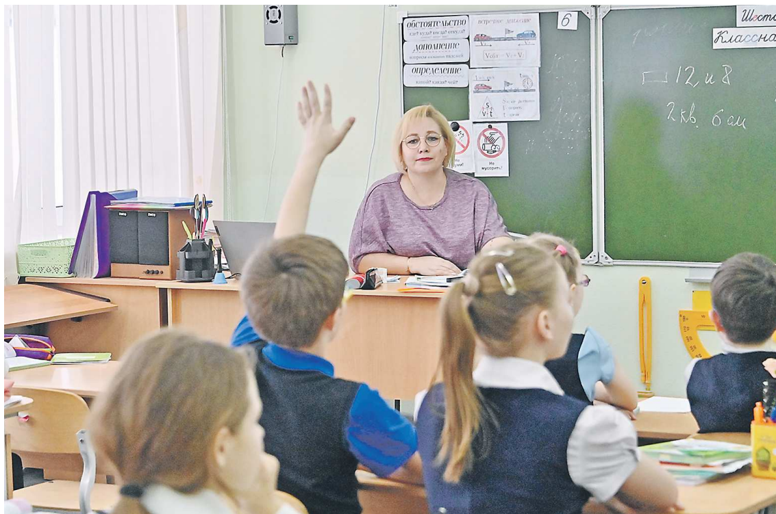
Все 10 преподавателей чувствуют себя комфортно в новом коллективе, педагоги сысертской школы №1 – это большая дружная семья

– Руководство у нас очень адекватное, коллеги доброжела-