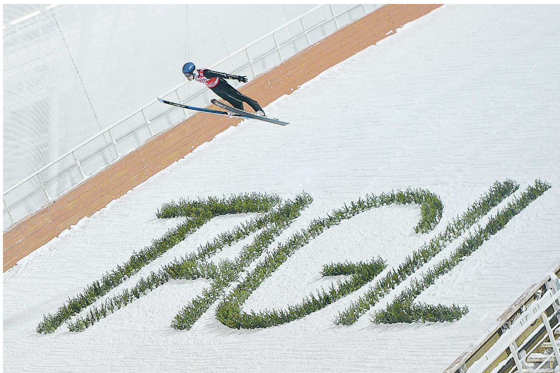
Прыжки на лыжах с трамплина – один из самых зрелищных видов программы Спартакиады