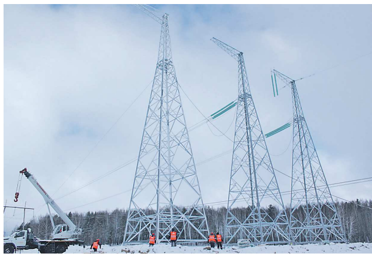
Установка опор на магистральной ЛЭП

Обеспечение временных объектов для реализации проекта.