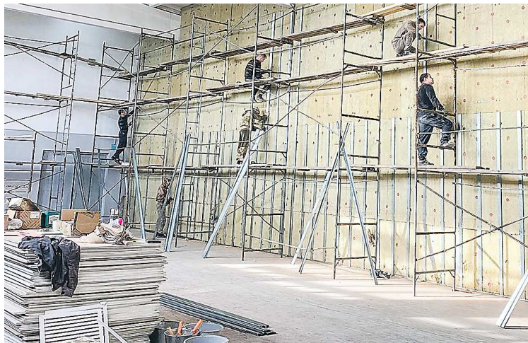
Бывший спортивный зал полностью переоборудуют для занятий хореографических коллективов

– Мы провели масштабные работы по реконструкции