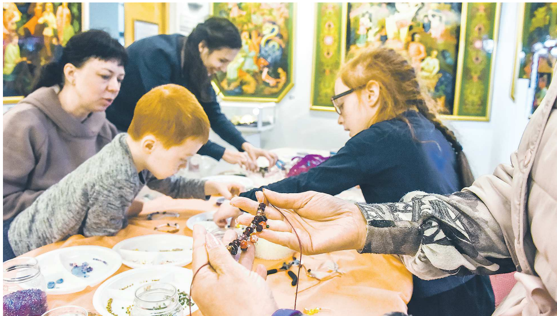
4 ноября Музей истории камнерезного и ювелирного искусства будет работать рекордные для себя 11,5 часов. В программе – не только экскурсии, но и интересные мастер-классы

– События отражают тематику Года семьи и направлены на развитие патриотизма, семейных ценностей, привитие уважения к старшим. Основная задача – показать многообразие культур народов, проживающих в регионе, – говорит гендиректор Инновационного культурного центра Свердловской области Николай