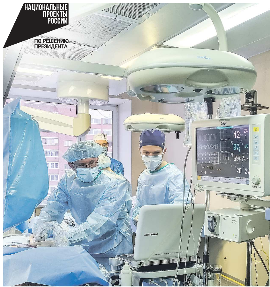
Врачи хирургической службы ОДКБ ежегодно выполняют до 900 оперативных вмешательств новорожденным и детям до 17 лет

Ежегодно специалисты хирургической службы ОДКБ выполняют 850 – 900 эндоскопических оперативных вмешательств новорожденным и детям до 17 лет включительно, имеющим урологическую патологию. Здесь в числе про-