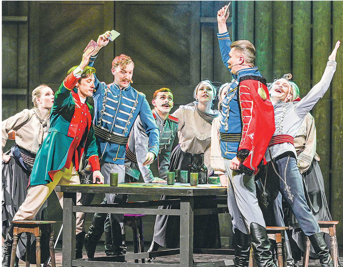
В сцене, где Петра Гринёва затягивают в карточную игру, звучит музыкальная отсылка к «Пиковой даме» Пушкина: герои многократно повторяют заветную комбинацию: «тройка, семерка, туз»

Персонаж также выступает символом судьбы. Тема поддерживается и в отсылках к другим произведениям Александра Сергеевича: когда Гринёву по сюжету предлагают сыграть в кар-