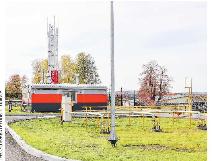
ПРЕСС-СЛУЖБА ГРУППЫ «Т ПЛЮС»

Компании присвоен ESG-рейтинг ESG-C3, уровень ESG-5, что соответствует высокой оценке в области экологии, социальной ответственности и управления.