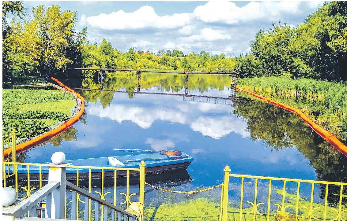
Водное растение эйхорния позволяет очистить пруды, загрязненные сточными водами

Вокруг предприятия расположена система государственного мониторинга, но иногда