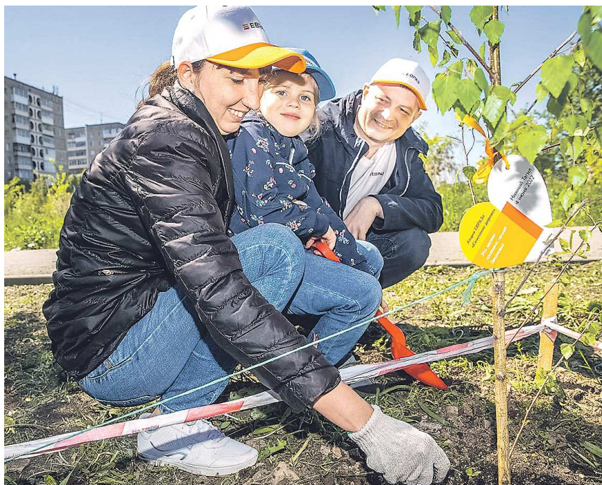
ПРЕСС-СЛУЖБА ЕВРАЗ НТМК

Чтобы развеять мифы о предприятии (в том числе о масштабах выбросов) НТМК уже третий год реализует такое направление, как промышленный туризм. С одной стороны, это позволяет простым жителям узнать, как выглядит предприятие, как построен производственный процесс, а с другой – помогает сформировать положительное отношение к заводу у подрастающего поколения. В перспективе это поможет решить кадровую проблему, считают в ЕВРАЗ НТМК.