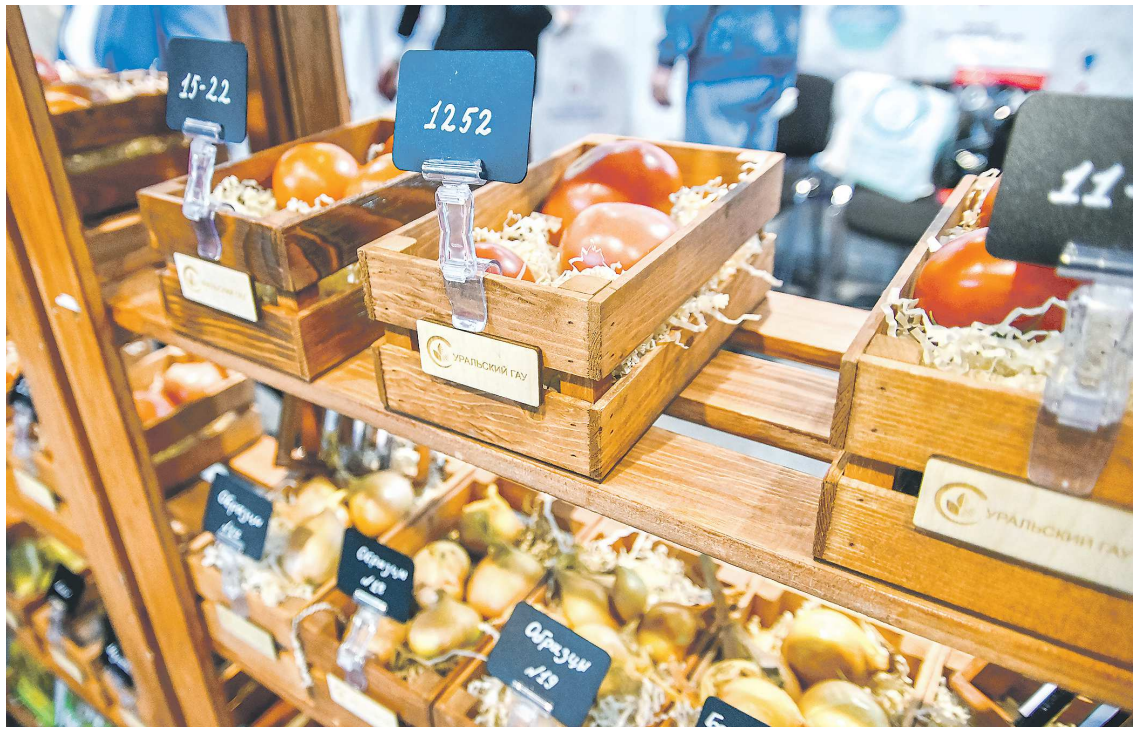
Уральский государственный аграрный университет представил образцы сортов картофеля, томатов, моркови, лука и других овощей, адаптированных для выращивания на Среднем Урале

– Представляем образцы овощных культур. Сорта адаптированы к нашей зоне: с резко континентальным кли-