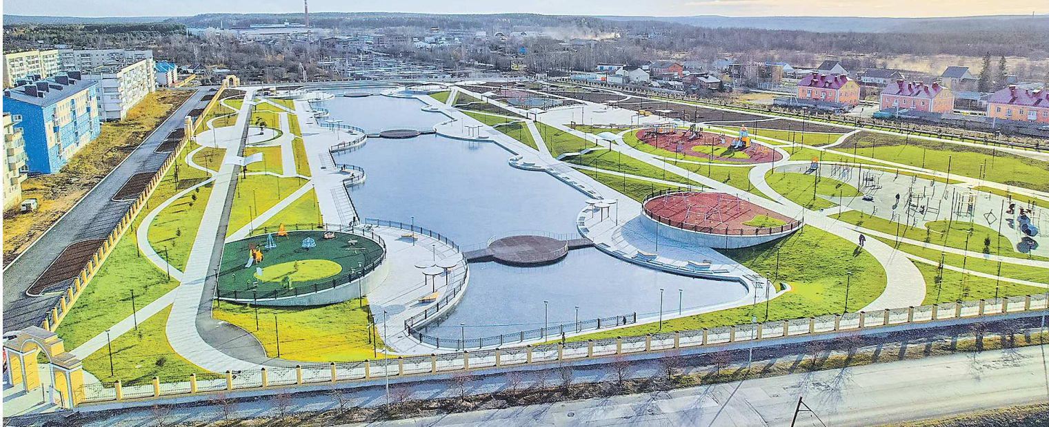
Благоустройство набережной стало одним из самых масштабных проектов по преобразованию общественного пространства на Северном Урале

В Волчанске в рамках проекта «Формирование комфортной городской среды» нацпроекта «Жилье и городская среда» открыли новую набережную. Мечту жителей города удалось осуществить благодаря поддержке губернатора Свердловской области Евгения КУЙВАШЕВА. Стоимость проекта составляет 463 миллиона рублей.