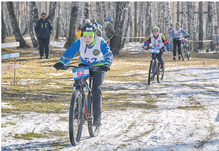
Погода вмешалась в проведение соревнований, спортсмены преодолевали дистанцию в том числе и по снегу

Несмотря на то, что первые забеги начались только в 11 утра, спортсмены собрались на базе