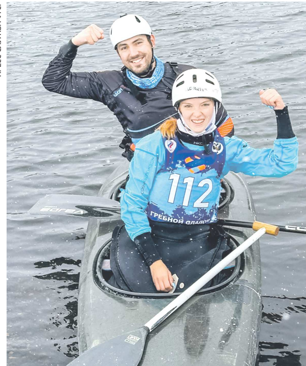
Несмотря на погоду, первые соревновательные дни прошли на реке Тагил

На станции юных туристов «Полюс» многолюдно. С самого утра здесь проходит ожесточенная борьба за медали чемпионата УрФО. К небольшому, на первый взгляд, бассейну не подступиться – везде стоят участники, их друзья и родственники. Атмосфера здесь по-настоящему теплая. Несмотря на спортивный азарт и конкуренцию, все активно поддерживают и помогают друг другу. Такая атмосфера сложилась здесь неслучайно, большинство участников знают друг друга с детства.