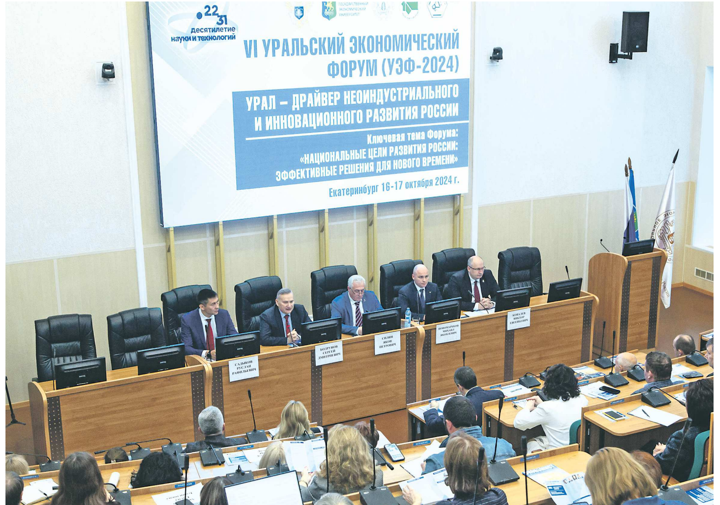
VI Уральский экономический форум (УЭФ) «Урал – драйвер неиндустриального и инновационного развития России»

– Где эти точки будут быстрее всего развиваться? Там, где есть традиции, фундаментальная промышленная база, сырье, кадры... Причем не только кадры, которыми мы располагаем сейчас, но которые еще надо вырастить, а значит, долж-