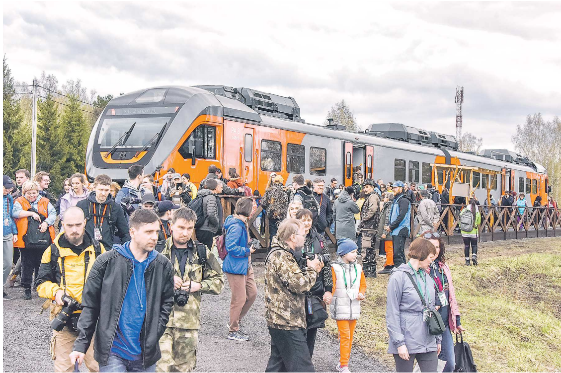
Другое популярное направление – Оленьи ручьи – за 25 лет посетили более 1,5 миллиона туристов

Одна из тем, которые обсуждают на форуме, – развитие туризма в малых городах и селах. В этом направлении, как считает исполнительный директор Ассоциации туроператоров России, важнее всего взаимодействие между муниципальными органами власти и бизнесом.