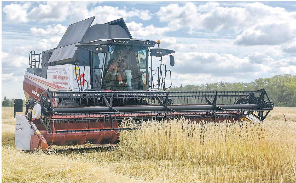
В 2024 году свердловские аграрии засеяли 492 тыс. гектаров земли. Увеличены площади посевов кормовых культур до 369,3 тыс. гектаров. Масличные культуры посеяны на площади 38 тыс. гектаров, а картофель и овощи – на площади почти 14 тыс. гектаров

К примеру, агрофирма «Патруши» ежегодно приобретает технику, часть затрат на которую компенсирует благодаря так называемой технической субсидии.