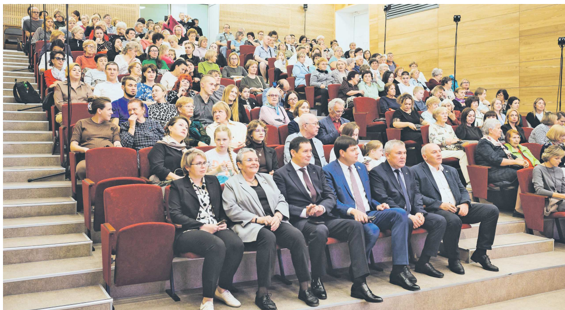
Обновленный зал будет доступен не только для учеников школы, но и для всех любителей музыки

Реконструкция продолжалась 2 года. В прошлом году была переоборудована сцена, в этом прошли работы в самом зале: обновили напольное покрытие, стены, потолок и, конечно, кресла (зал рассчитан на 220 мест). Кроме того, полностью заменили систему отопления и освещения. На сцене были смонтированы профессиональное звуковое оборудование и видеозэкран, также удалось обновить музыкальные инструменты для школы.