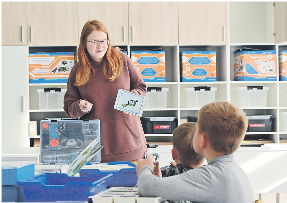
В новом технопарке «Кванториум» проходят не только уроки по общеобразовательным предметам, но и занятия в рамках дополнительных кружков