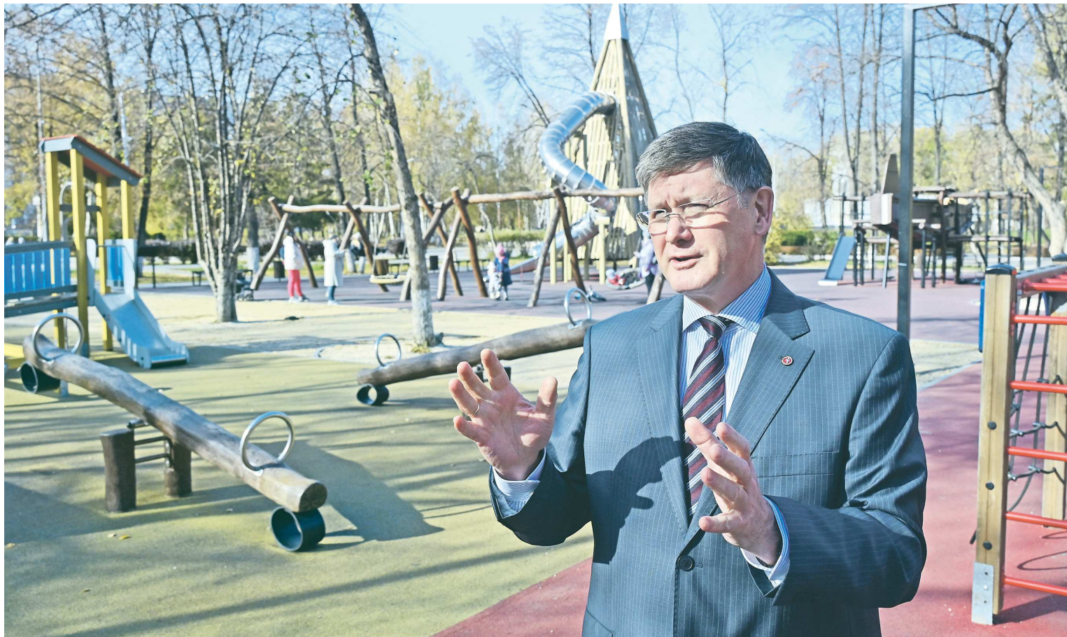
Парк Победы в Березовском значительно преобразился в рамках ФКГС, за три года здесь не только обновили мемориальный комплекс, но и построили современную детскую площадку

Еще в 2013 году мы разработали целый ряд проектов планировок промышленных зон, и сегодня, спустя более десяти лет, это уже дает видимые результаты: у нас появляются все новые и новые налогоплательщики. То есть за это время земельные участки прошли процедуры аукционов, появились собственники или арендаторы, они построили здания, оснастили соответствующим оборудованием, наняли персонал, запустили производство, и сейчас это уже выливается в дополнительные доходы местного бюджета. Один из системообразующих налогов – налог на доходы физических лиц – у нас показы-