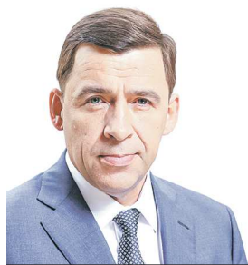
Губернатор Свердловской области Евгений КУЙВАШЕВ