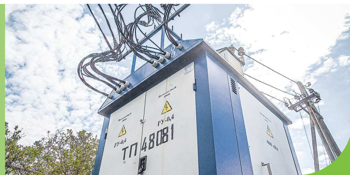
За счет субсидий можно компенсировать половину затрат СНТ на новую мощную подстанцию

Прием заявок на участие в конкурсе на получение субсидии и предоставление документов, подтверждающих проведение работ, стартовал в уральской столице в начале минувшего месяца, а завершится 8 октября. Так что у членов садоводческих и огороднических товариществ еще есть время, чтобы успеть подать заявку.