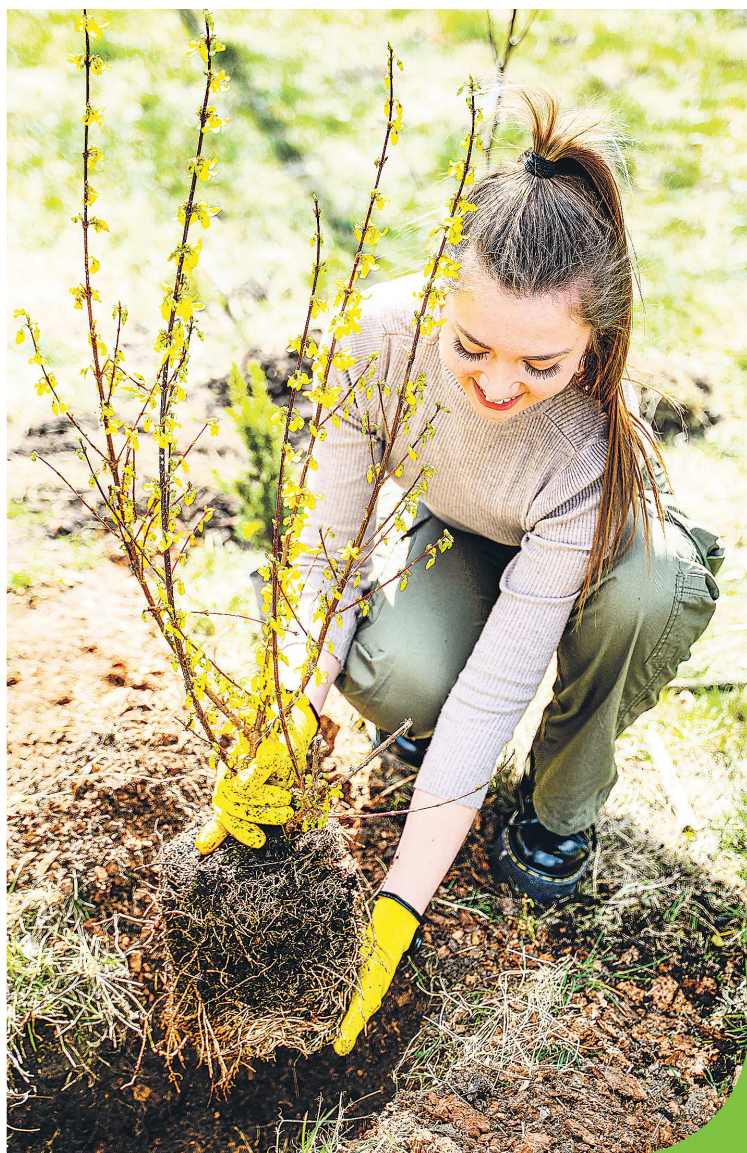
Нынче бабье лето дает возможность садоводам продлить осенние посадки