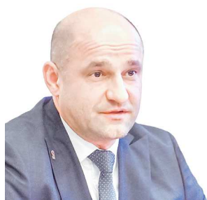
Полномочный представитель Президента России в Уральском федеральном округе Артём ЖОГА