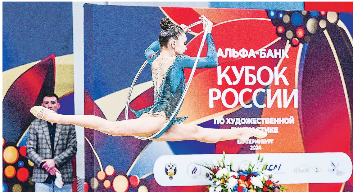
Совсем недавно Екатеринбург с размахом принял Кубок России по художественной гимнастике