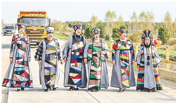
Открытие моста, на котором выступили местные творческие коллективы, стало праздником для жителей поселка Фабричное

Новый мост объединил отдаленный район поселка с его центральной частью, где расположены все основные социально важные объекты, включая школу и досуговый центр, фельдшерско-акушерский пункт и так далее.