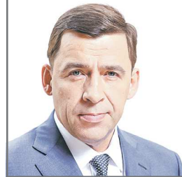
Губернатор Свердловской области Евгений КУЙВАШЕВ