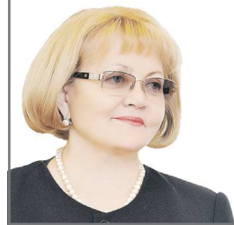
Председатель Законодательного Собрания Свердловской области

Пусть здоровье никогда вас не подводит. Счастья вам, радости, душевного тепла и близких людей рядом.