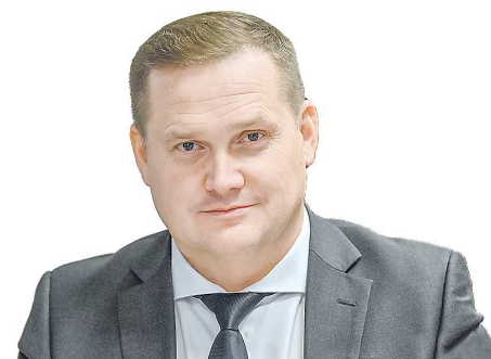
Вячеслав ЯРИН, министр международных и внешнеэкономических связей Свердловской области

« Приоритетной сферой партнерства Свердловской области с регионами Китая является торгово-экономическая. Китай на протяжении нескольких лет занимает первое место по объемам торговли среди всех зарубежных партнеров Свердловской области. В условиях действия экономических ограничительных мер мы ощущаем, что взаимный интерес представителей бизнес-кругов к наращиванию делового сотрудничества значительно вырос. В настоящий момент мы ведем переговоры по вопросам строительства логистических комплексов для промышленной и сельскохозяйственной продукции. Прорабатываем с китайскими партнерами возможность их участия в реализуемых в Свердловской области крупных инфраструктурных проектах, таких как «Сухой порт» и технопарк высоких технологий «Космос».