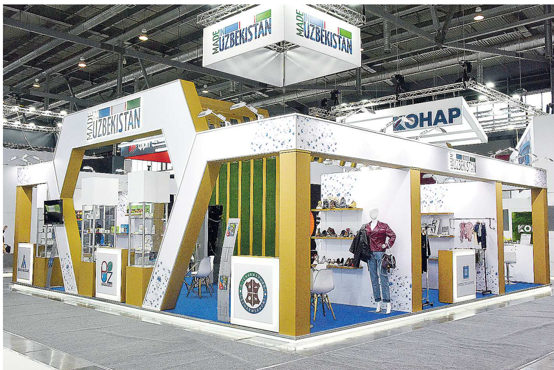
Стенд Узбекистана на промышленной выставке ИННОПРОМ-2024

проявляет интерес к организации деятельности на территории региона. В июле 2024 года в Екатеринбурге открыли торговый дом «SAG ковры» – первый в Российской Федерации брендовый магазин ведущего производителя самаркандских ковров.