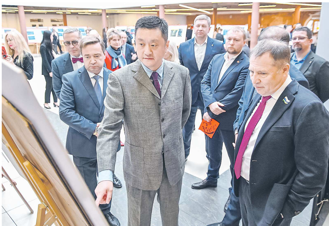
Исполняющий обязанности Генерального консула КНР в Екатеринбурге Ван Тун (в центре) на открытии фотовыставки, посвященной 75-летию со дня основания Республики

Исполняющий обязанности консула в Екатеринбурге обратил внимание гостей торжественного приема, что по итогам