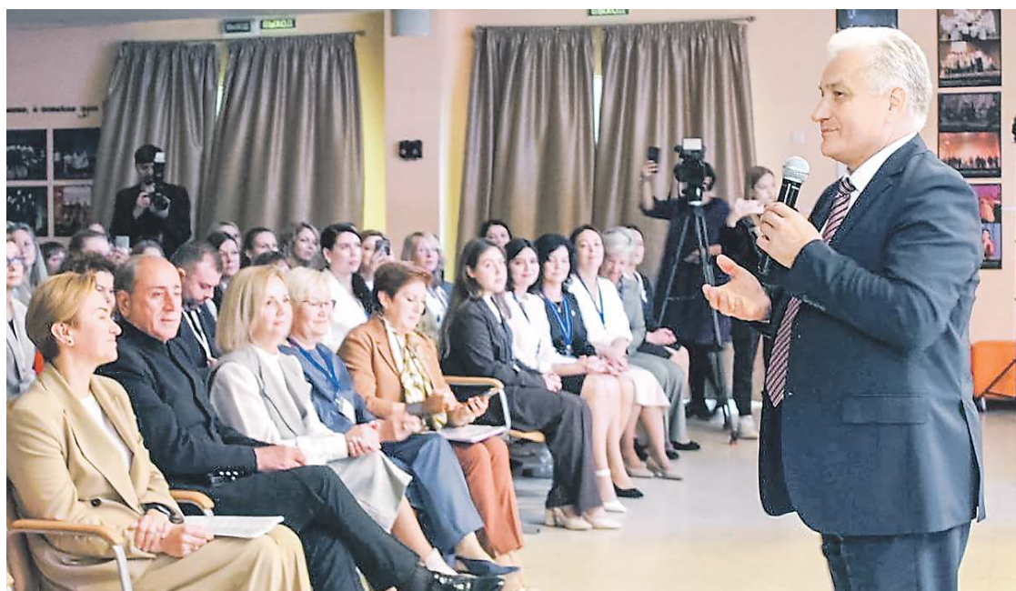
Старт профессиональному смотру в екатеринбургской гимназии №104 дал министр образования и молодежной политики региона Юрий Биктуганов