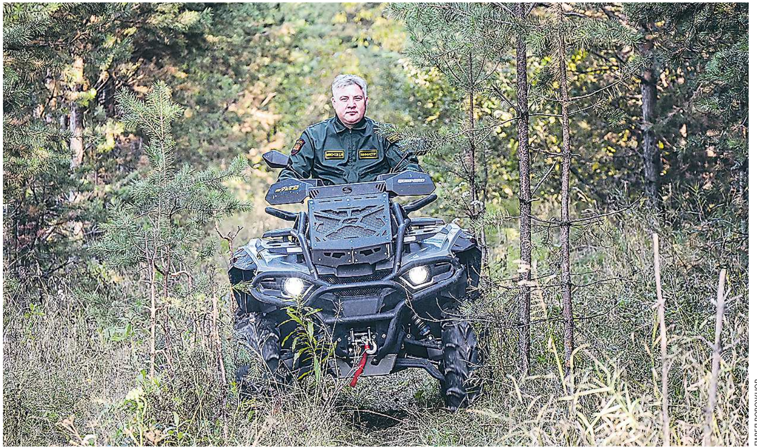
За состоянием свердловских лесов министр следит с квадроцикла, который хорошо подходит для грунтовых дорог

– Классическая технология тушения торфяника предполагает его обводнение и использование торфяных стволов, водных магистралей – то есть заполнение водой. Зимой для тушения достаточно снизить температуру. Для этого очаги горения, так называемые каверны, надо вытащить на поверхность.