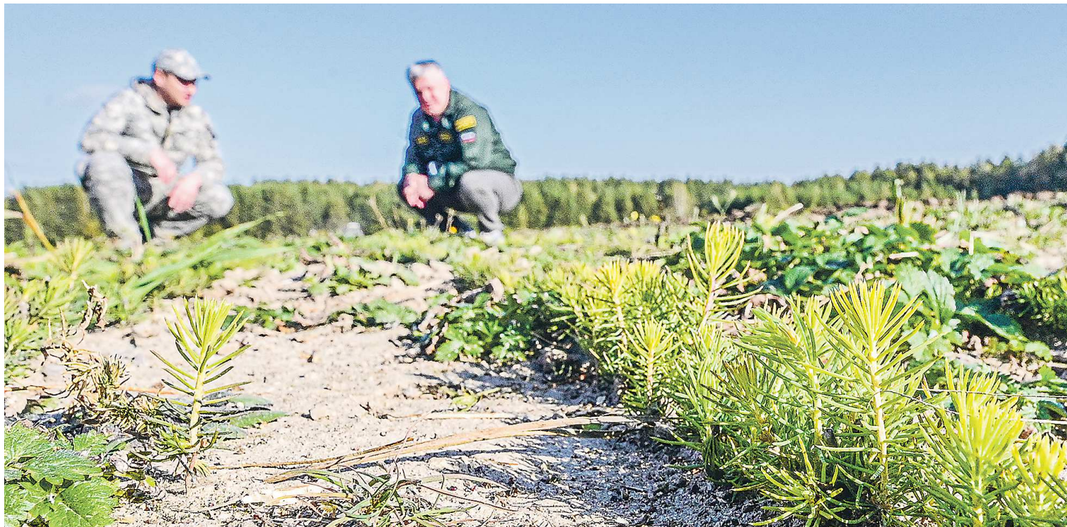
Сеянцы ели растут в питомнике в течение трех лет, потом их пересаживают в зоны лесовосстановления