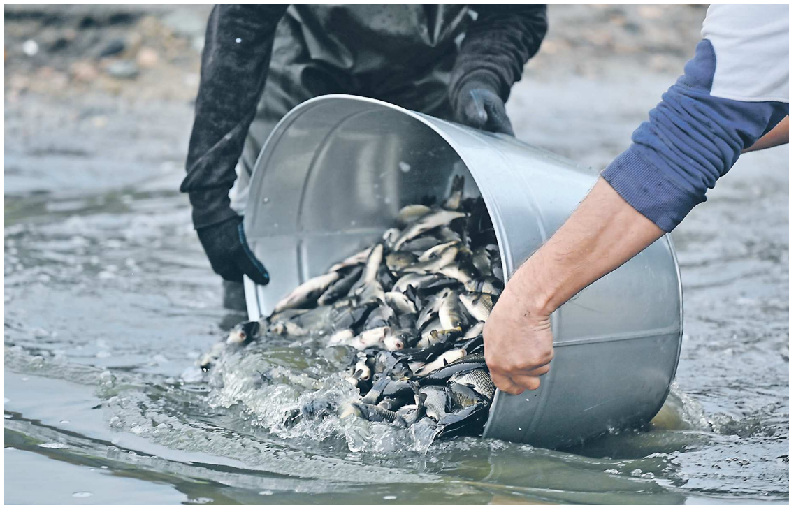
Растительные рыбы, которых выпускают в водоемы, помогают защитить их от заболачивания

Несколько дней назад свыше 10 тысяч мальков сазана выпустили в Верх-Нейвинское водохранилище. Зарыбление Верх-Нейвинского водохранилища проходит второй год подряд. Растительные рыбы