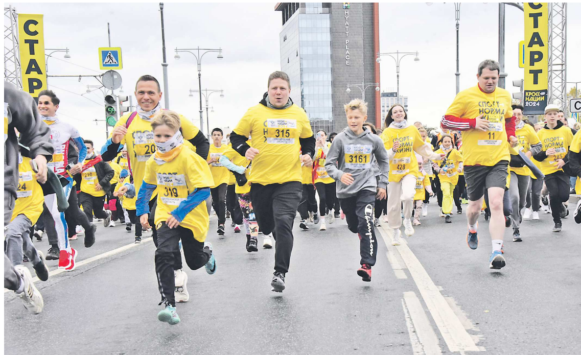
Юбилейный «Кросс нации» получился по-настоящему массовым

Тысячи екатеринбуржцев приняли участие во Всероссийском дне бега «Кросс нации»