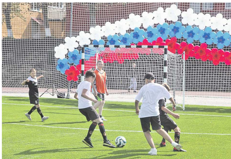
Новый стадион открылся к началу учебного года

ПРЕСС-СЛУЖБА АДМИНИСТРАЦИИ ГО ПЕРВОУРАЛЬСЬК