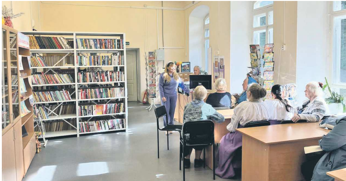
Библиотека уже пользуется спросом