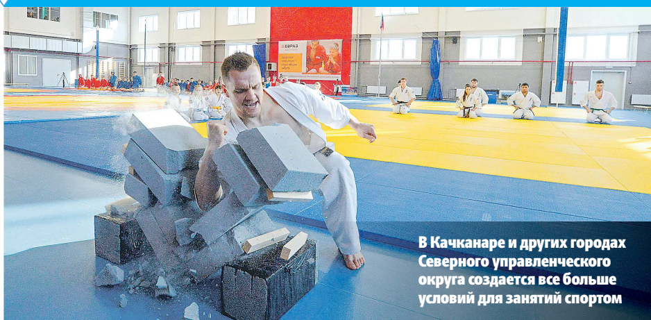
В Качканаре и других городах Северного управленческого округа создается все больше условий для занятий спортом