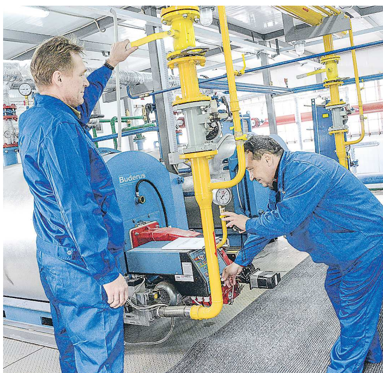
Готовность Свердловской области к отопительному периоду составляет 98,3%