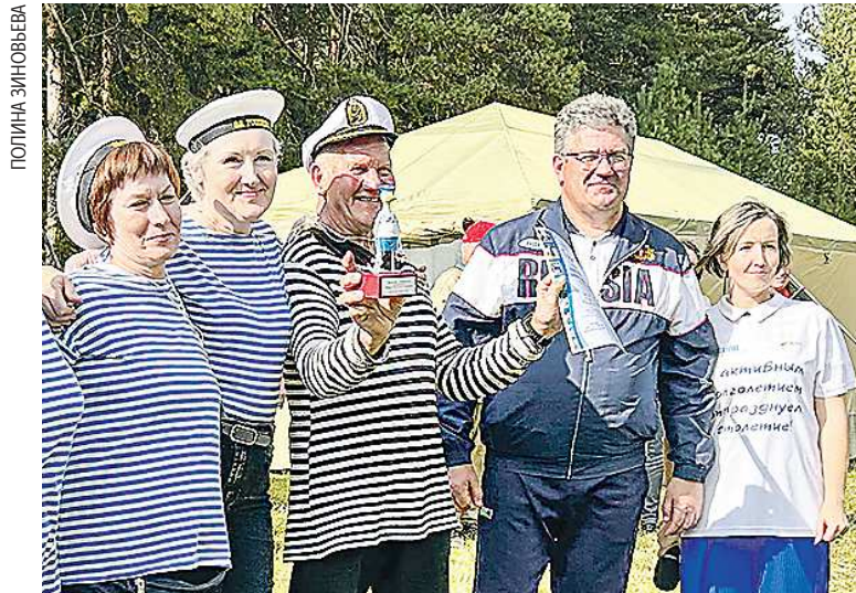
Тринадцатый туристический слет для граждан пожилого возраста «Покровский привал-2024» (Артёмовский ГО)

– В регионе серьезно расширяются программы компенсаций в рамках социальной газификации благодаря законодательным инициативам губернатора Евгения Владимировича Куйвашева. Сейчас при подключении к сетям индивидуальных жилых домов можно получить компенсацию в размере 100 тыс., 175 тыс. или 250 тыс. рублей. Это хорошие цифры, Свердловская область находится в пятерке субъектов РФ, имеющих самые объемные льготы в данной сфере. В категорию льготников включе-