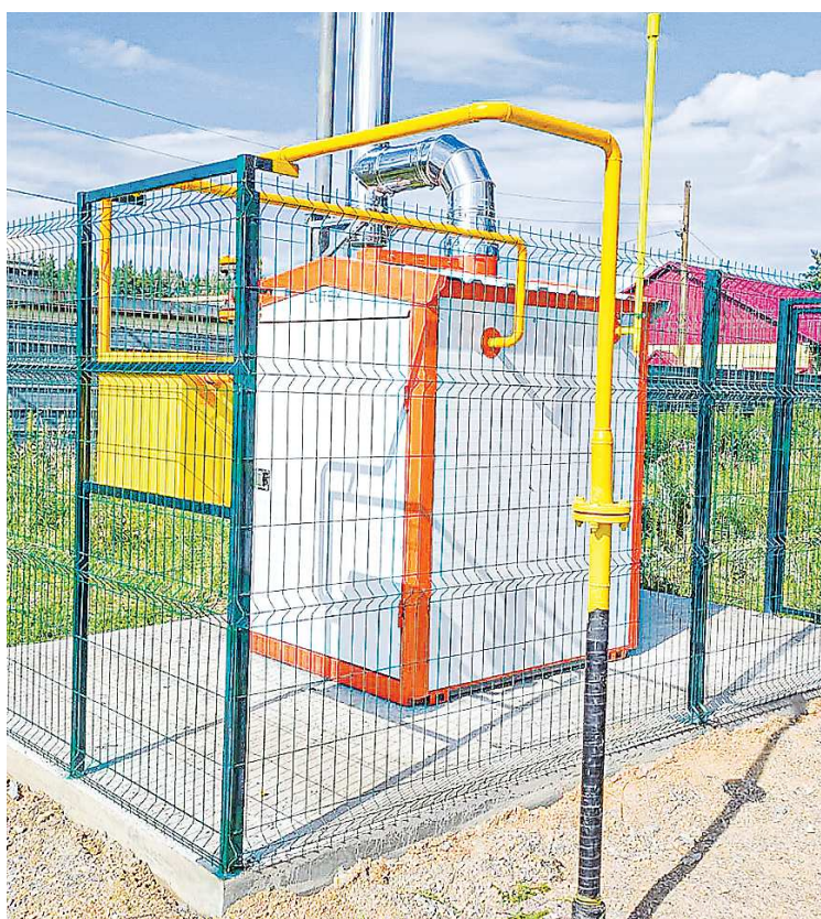
Летний период свердловские муниципалитеты использовали для ремонта старых и запуска новых коммунальных объектов