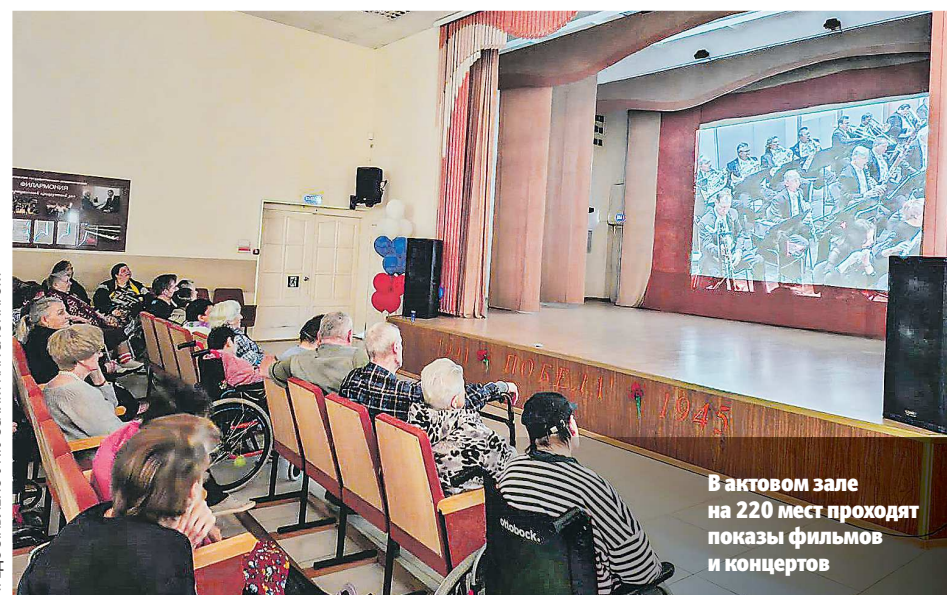
В актовом зале на 220 мест проходят показы фильмов и концертов