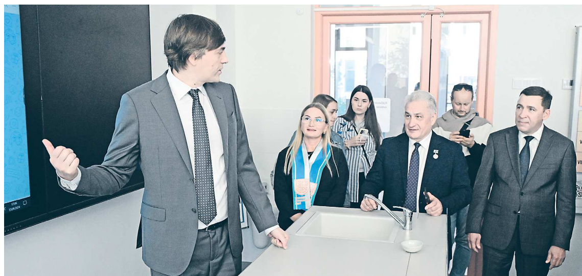
В ходе визита Сергей Кравцов осмотрел Уральский губернаторский лицей. На вопросы главы Минпросвещения РФ отвечал министр образования и молодежной политики Свердловской области Юрий Биктуганов

Визит министра просвещения РФ Сергея Кравцова подтвердил уникальность Свердловской области в этой сфере