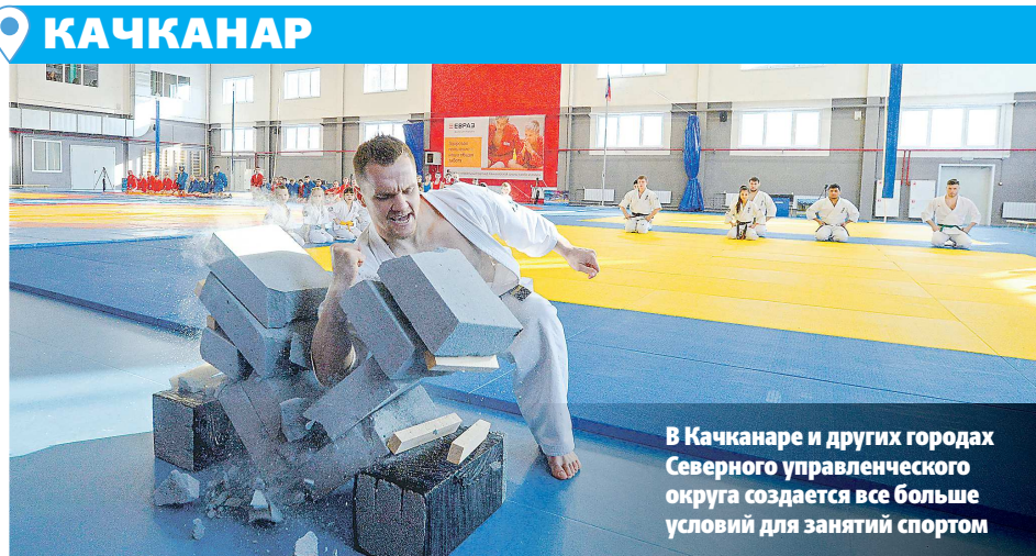
В Качканаре и других городах Северного управленческого округа создается все больше условий для занятий спортом

Интервью подготовила Дарья МАРИНИНА специально для «Областной газеты».