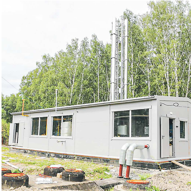
Новая котельная в селе Яр (Талица)

Котельная будет снабжать теплом жителей села и социальные объекты – детский сад, школу, Дом культуры и другие. Кроме того, строительство ветки газопровода от новой котельной создаст возможность для начала реализации программы догазификации в населенном пункте.