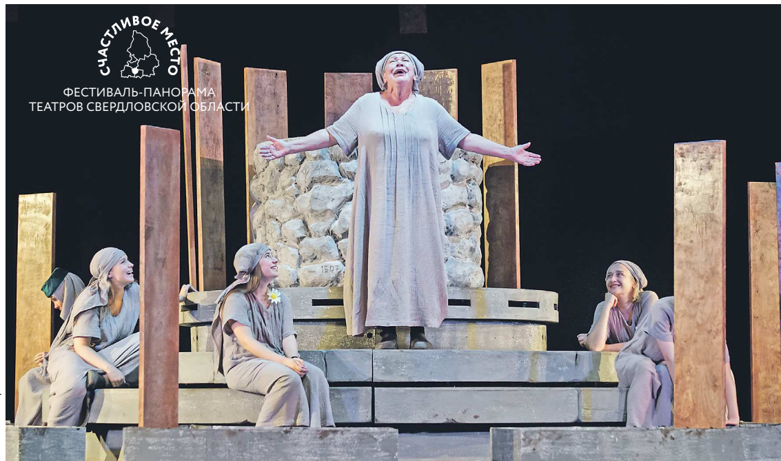
Спектакль «Весталка» Драмы Номер Три (Каменск-Уральский) поставлен по роману уральца Николая Никонова

– Город представлен сразу тремя театрами – Новый молодежный, Театр кукол и Нижнетагильский драматический. Разумеется, подбирали афишу так, чтобы прозвучал и трудовой город, и в то же время хотелось показать разнообразие репертуара