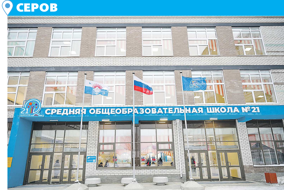
Новая школа №21 в Серове стала еще одним современным образовательным центром Северного управленческого округа

Знаковое событие – открытие спортивного ядра «Олимп» в 2023 году – с искусственным газоном и универсальной спортивной площадкой, шестью беговыми дорожками, тренажерами... Завершаются работы по строительству модульного здания, где будут размещены раздевалки и душевые для спортсменов. Это открывает возможности проводить сорев-