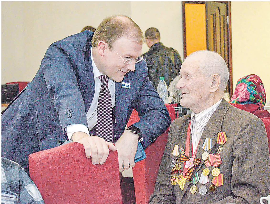
В преддверии празднования Дня Победы – встреча с ветеранами Артёмовского городского округа

– В весеннюю сессию мы внесли два изменения, чтобы привести региональное законодательство в соответствие с федеральным. Первое – по поводу использования обозначения «муниципальный округ» перед названием территории.