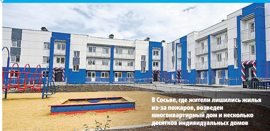
В Сосьве, где жители лишились жилья из-за пожаров, возведен многоквартирный дом и несколько десятков индивидуальных домов

ДЕПАРТАМЕНТ ИНФОРМАТИКИ СВЕРДЛОВСКОЙ ОБЛАСТИ