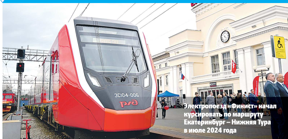
Электропоезд «Финист» начал курсировать по маршруту Екатеринбург – Нижняя Тура в июле 2024 года