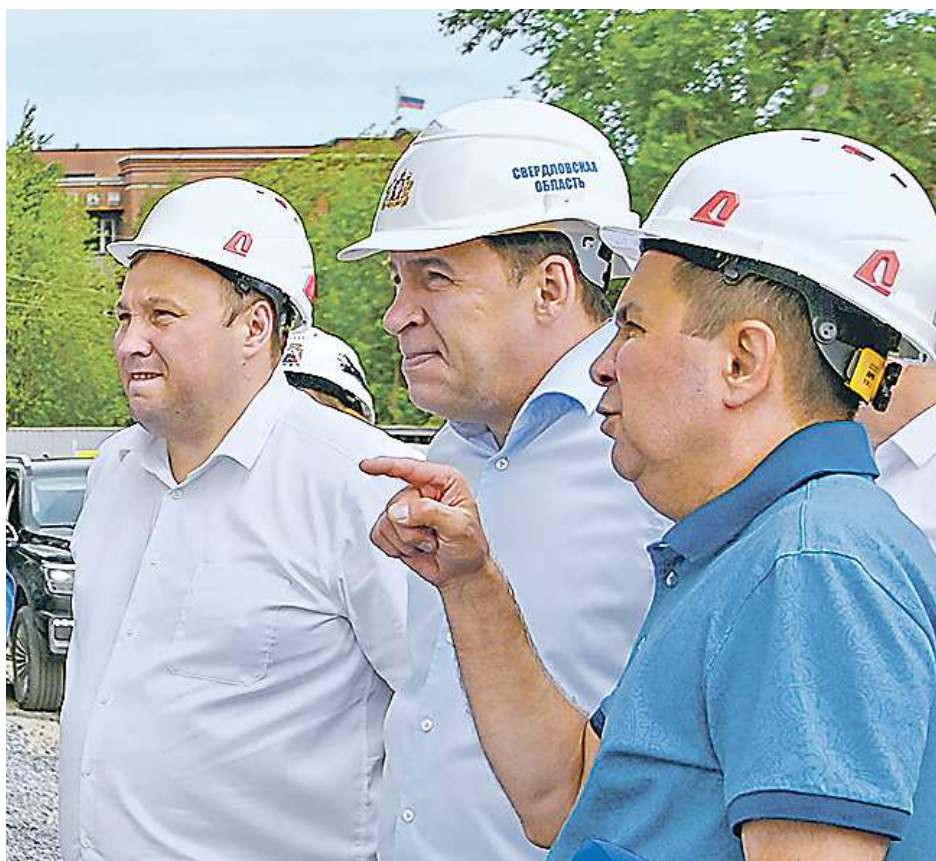
Александр Вервейн, Евгений Куйвашев и Сергей Швиндт (слева направо) осматривают строящуюся школу на 500 мест в Краснотурьинске

В Волчанске при поддержке губернатора реализуется уникальный проект малоэтажного строительства: возводятся одноэтажные двухквартирные коттеджи для переселения горожан из аварийного жилья, в прошлом году были сда-