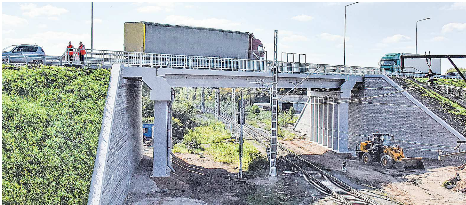
Подобный проект уже успешно реализован на Тюменском тракте в Богдановиче

Федеральная трасса Екатеринбург – Шадринск – Курган связывает между собой два региональных центра, а также пересекает Транссибирскую магистраль. Сейчас из-за активного потока автомобилей на железной дороге об-