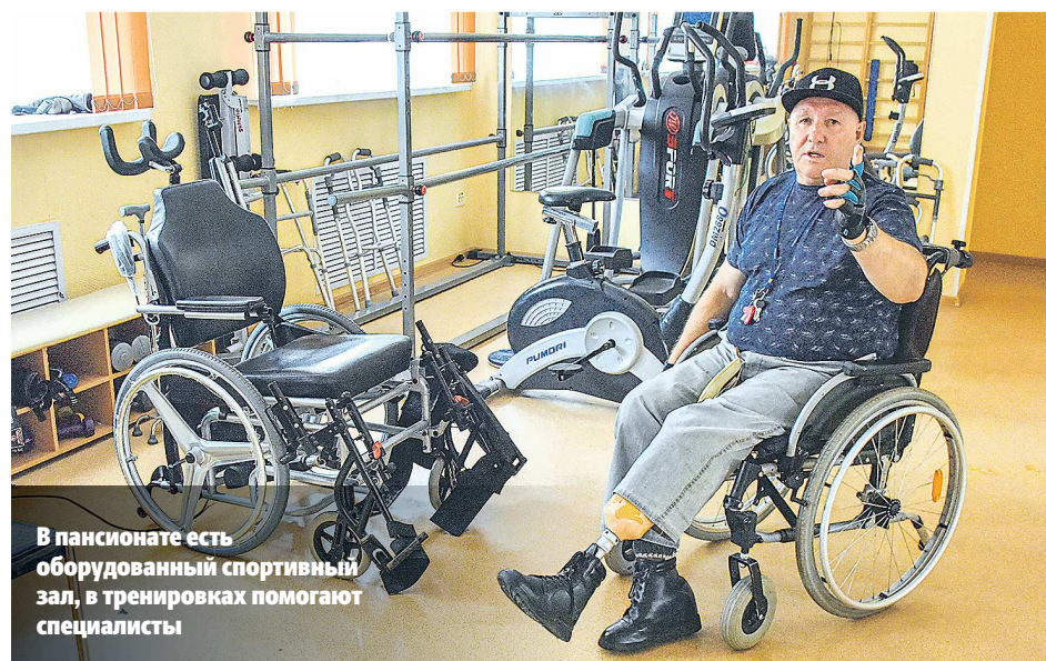
В пансионате есть оборудованный спортивный зал, в тренировках помогают специалисты