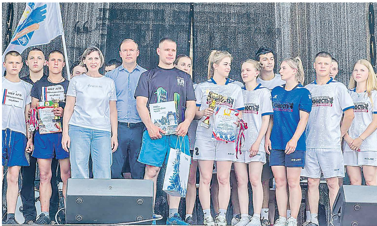
Празднование Дня России в городе Артёмовском