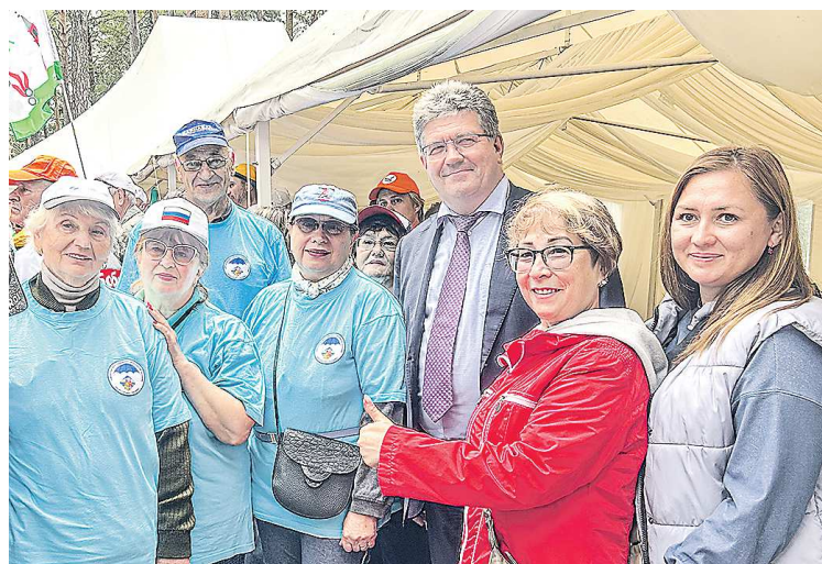
Ежегодный областной туристический слет для пенсионеров

ной жизни старшего поколения играют ветеранские организации, как их поддерживают власти региона?