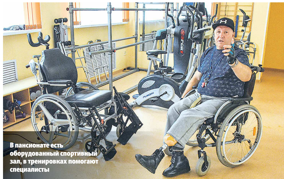
В пансионате есть оборудованный спортивный зал, в тренировках помогают специалисты