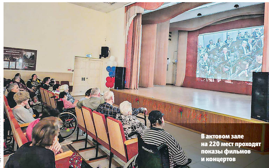
В актовом зале на 220 мест проходят показы фильмов и концертов