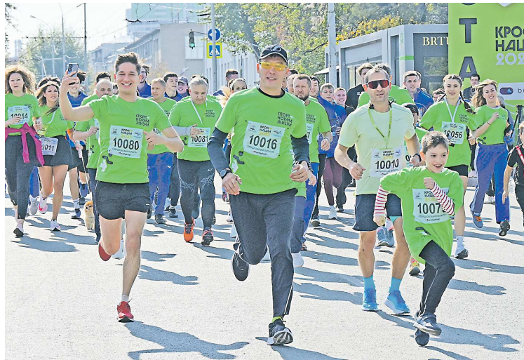
Ежегодный «Кросс нации» собирает как профессионалов, так и любителей бега

Регистрация для участия в «Кроссе нации» организована на портале «Госуслуги» до 19 сентября включительно. При оформлении заявки можно выбрать