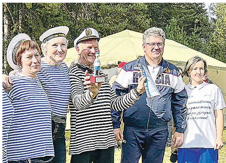
Тринадцатый туристический слет для граждан пожилого возраста «Покровский привал – 2024» (Артёмовский ГО)

– Какую роль в обеспечении насыщенной и качествен-