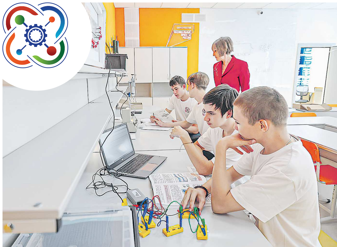
В школьном «Кванториуме» Ревды будут обучаться порядка 500 учащихся