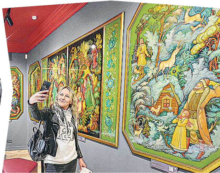
Самые знаковые культурные проекты среди свердловчан – «Ночь музыки», Международный книжный фестиваль «Красная строка» и акция «Ночь музеев»