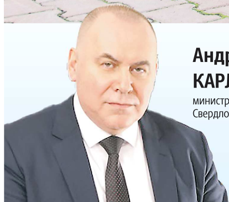
Андрей КАРЛОВ, министр здравоохранения Свердловской области

“ Наша главная цель – комплексная забота о здоровье людей старшего поколения, содействие активному долголетию ветеранов. Как правило, после 60 лет пациенты имеют определенные хронические заболевания. На сегодняшний день в Свердловской области открыты 275 гериатрических койко-мест в профильных стационарах, где уральцам доступно полноценное лечение, уход и психосоциальная реабилитация для комфортного взаимодействия с окружающими.