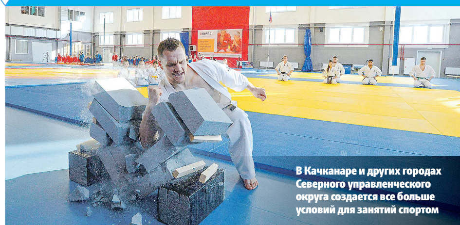
В Качканаре и других городах Северного управленческого округа создается все больше условий для занятий спортом