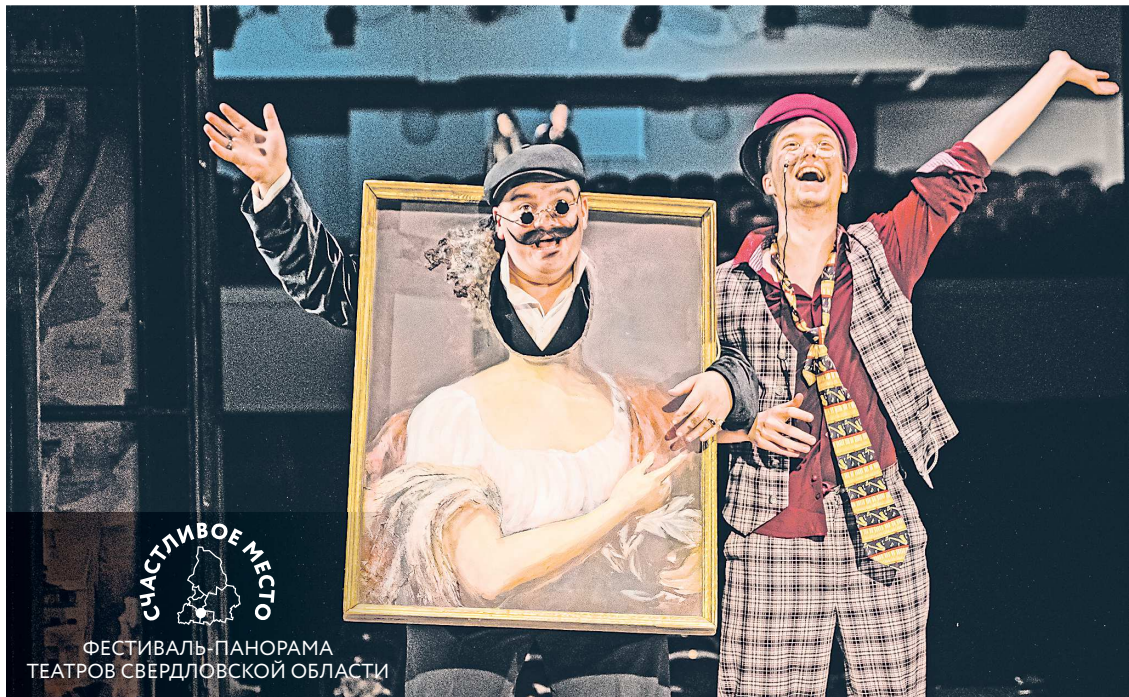
Сцена из спектакля «Мастер и Маргарита. Версия». Эпатажные и узнаваемые герои Булгакова, но Серовский театр предлагает собственный взгляд на историю