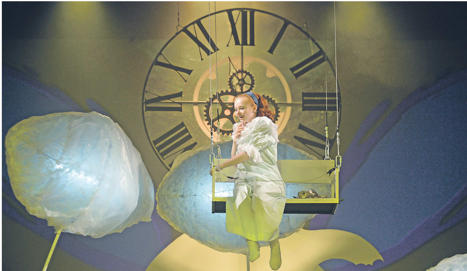
Сцена из известного спектакля одного из свердловских театров (проверьте себя — из какого?) говорит нам о том, что время театра пришло

Свердловский театр музыкальной комедии готовится к двухнедельным гастролям по Белоруссии: с 24 сентября по 7 октября труппа выступит в трех городах — Минске, Витебске и Бресте. Белорусские зри-