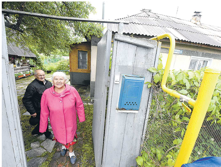
В первую очередь сети будут прокладывать в уже газифицированных СНТ

– Это не конечная цифра, есть задача проверить и проверить дальше, какие из СНТ подпадают под эти условия. Лучше всего, если их председатели сами придут к представителям муниципалитета и спросят: включили ли вы нас в соответствующий перечень, который подается в министерство энергетики и