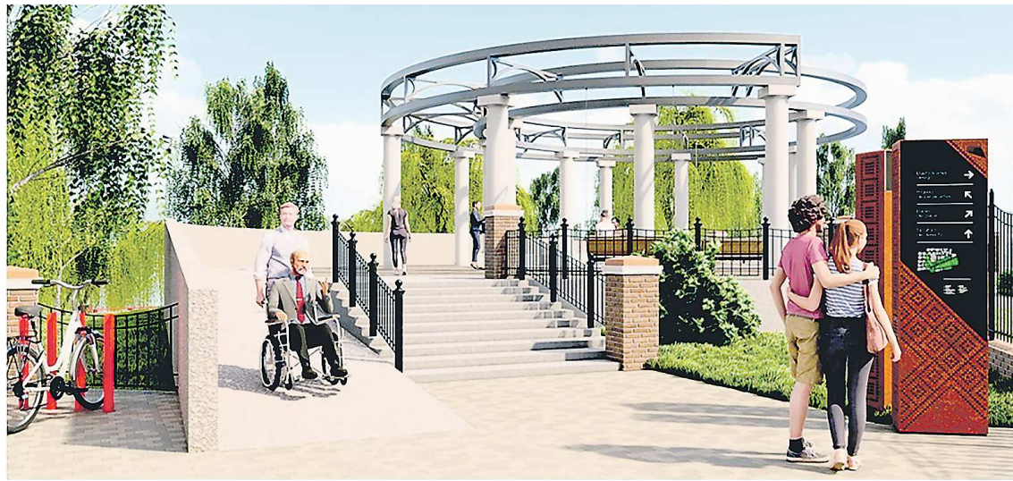
На набережной Красноуфимска появится парк с ротондой

– Победа во Всероссийском конкурсе лучших проектов создания комфортной городской среды позволит создать набе-