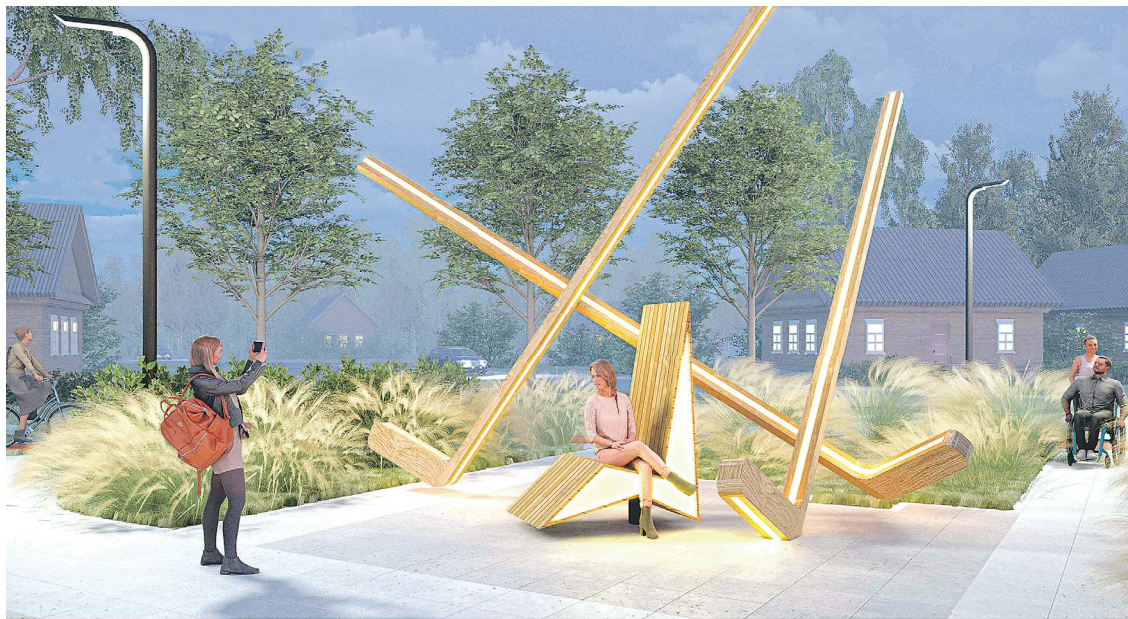
Одна из фотозон, которая появится на благоустроенном общественном пространстве в Верхней Туре, будет посвящена местному хоккейному клубу «Молния»

Так, музыкальная площадка будет знакомить гостей города с «дедушкой уральского рока» Александром Пантыкиным . На ней разместятся уличные музыкальные инструменты. Сквер «Пяти бегунов» будет отсылать к пешему переходу в 1935 году пяти рабочих Верхнетуринского машиностроительного завода от Верхней Туры до Москвы – они преодолели 2 050 км за 27 дней. «Космосквер» расскажет о полете в космос Андрея Федяева , учившегося в Верхней Туре. В мощении площадки будет выложена Земля и путь в космос, а качели станут инфографикой о полете космонавта в 2023