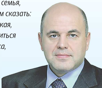
Михаил МИШУСТИН, председатель Правительства РФ

« С удовольствием отмечу, что из года в год проекты благоустройства Свердловской области признаются лучшими на федеральном уровне. Мы все понимаем, что в новых парках и скверах будут проводить время родители и дети разных возрастов, и для каждого найдется удобный и интересный формат отдыха.