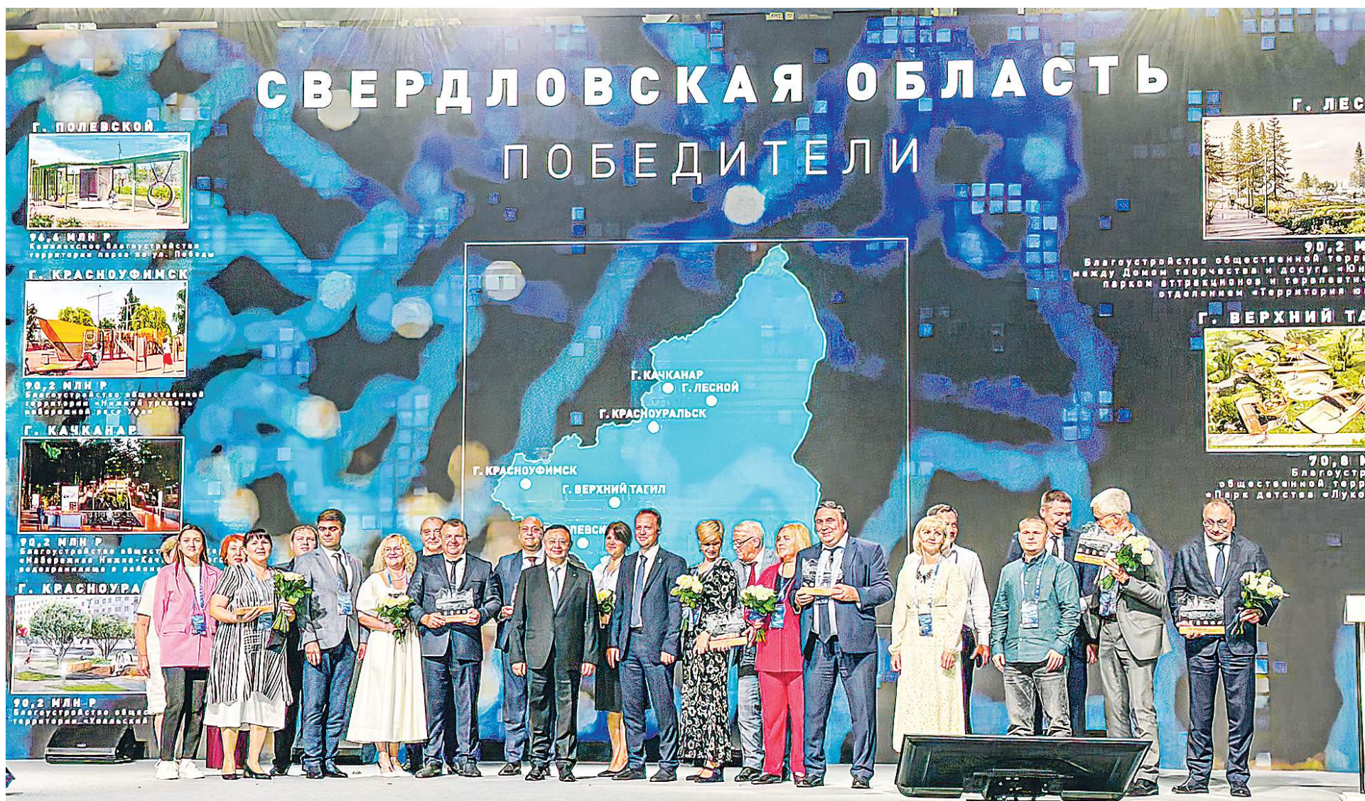
ДЕПАРТАМЕНТ ИНФОРМАЦИОННОЙ ПОЛИТИКИ СВЕРДЛОВСКОЙ ОБЛАСТИ

« Сейчас проходит Год семьи, который объявлен Президентом России. А семья в первую очередь – это дом, в котором бережно хранятся и передаются традиционные ценности. И так же, как мы с гордостью говорим, это моя семья, это мой дом. Так и с гордостью можем сказать: «Моя семья – Россия». Большая, крепкая, дружная. И вместе мы должны заботиться о ее благополучии, каждого ее уголка, каждого ее жителя.