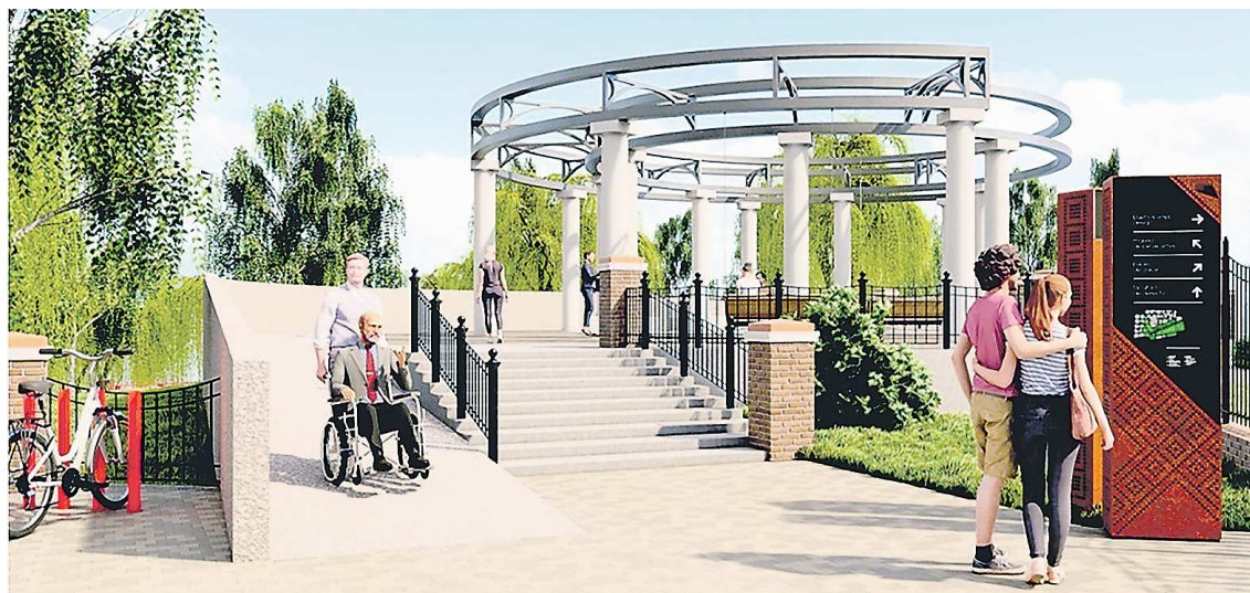
На набережной Красноуфимска появится парк с ротондой

– Победа во Всероссийском конкурсе лучших проектов создания комфортной городской среды позволит создать набе-