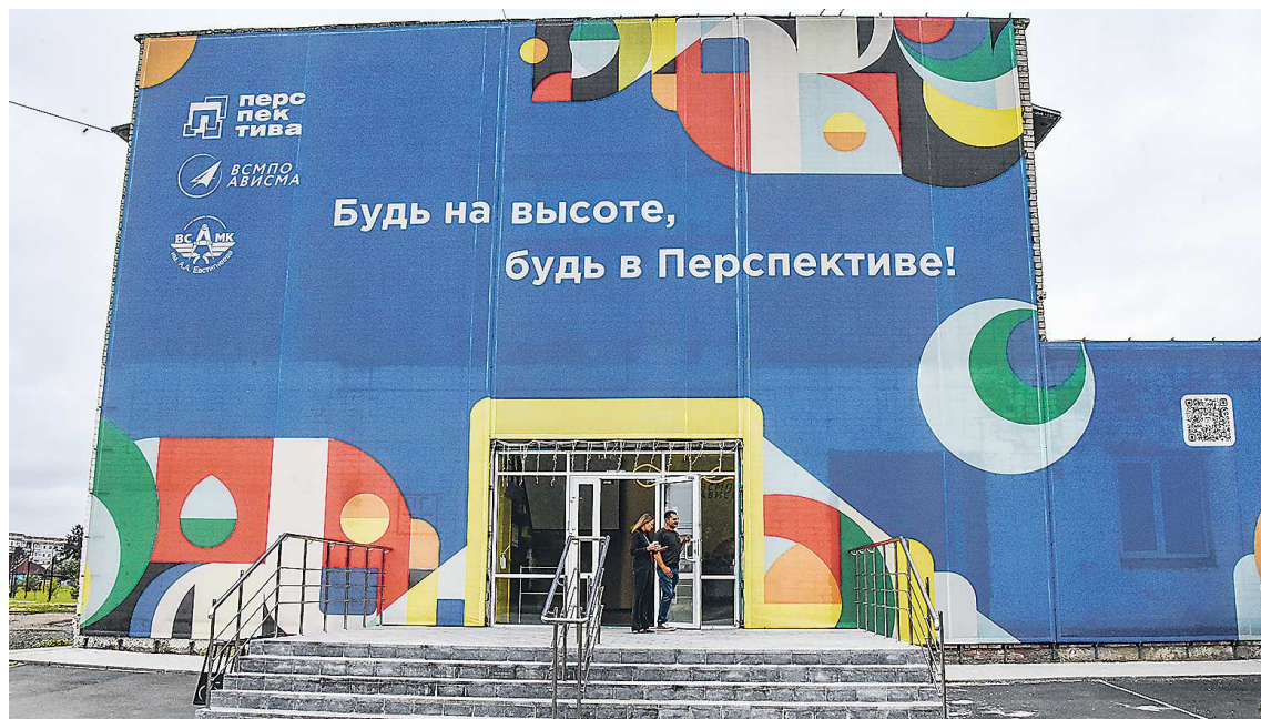
Обучение в профессионально-индустриальном кластере «Перспектива» проходят более одной тысячи школьников