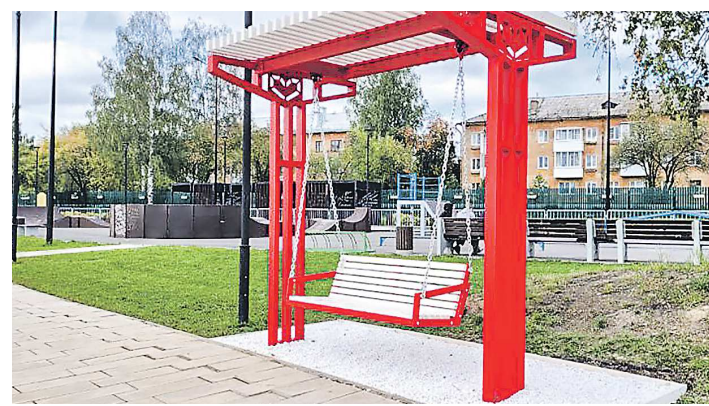
Торжественное открытие «Аллеи любви» прошло в городе в эту пятницу

«Аллея любви» представляет собой прогулочную зону, с одной стороны которой расположились необычные авторские скамьи, уже представляющие собой отдельные арт-объекты, а по другую сторону – фонтаны, оборудованные прямо на воде. Они круглогодичные и смогут радовать жителей и гостей города даже зимой.