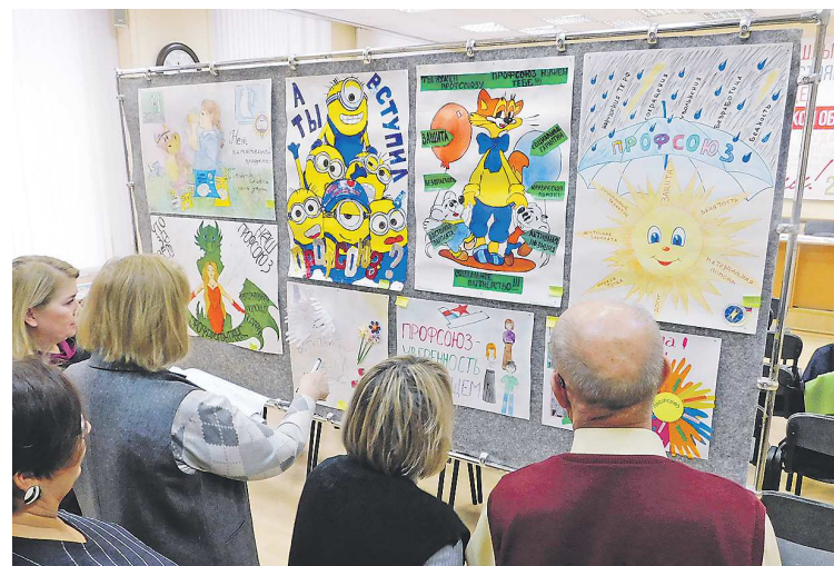
Конкурс агитационных плакатов прошел при поддержке департамента внутренней политики Свердловской области с привлечением средств Президентского гранта