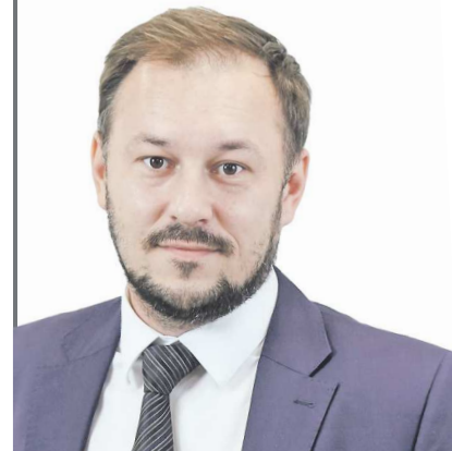
Первый вице-президент Свердловского областного Союза промышленников и предпринимателей

Пусть наше сотрудничество с органами власти и работодателями будет плодотворным и взаимовыгодным, чтобы каждый житель Свердловской области чувствовал поддержку и защиту со стороны профсоюзного движения.