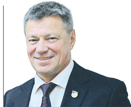
Председатель Федерации профсоюзов Свердловской области