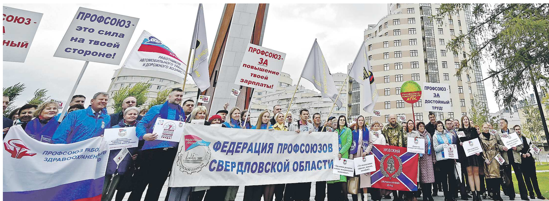
В ходе флешмоба в день коллективных действий профсоюзов активисты акцентировали внимание на необходимости развития социального партнерства