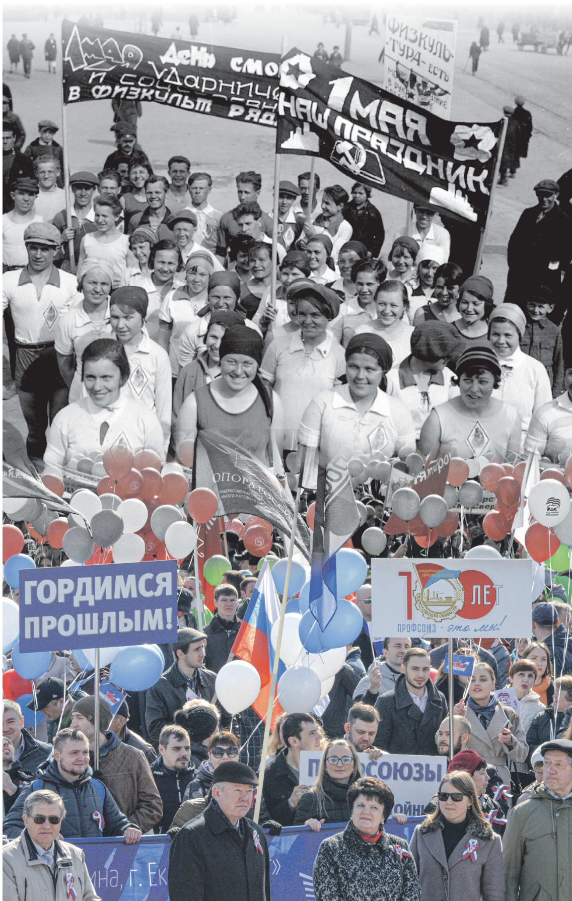
ПАВЕЛ ВОРОЖЦОВ / ГОСАРХИВ СВЕРДЛОВСКОЙ ОБЛАСТИ