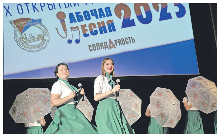
С каждым годом участников конкурса рабочей песни становится все больше

12 января 2024 года подведены итоги XV областного смотр-конкурса профсоюзного агитплаката, объявленного Федерацией профсоюзов Свердловской области в 2023 году. Всего на суд жюри были представлены 174 плаката.