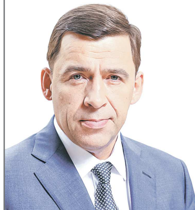
Губернатор Свердловской области Евгений КУЙВАШЕВ