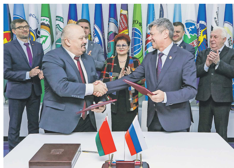
В 2023 году делегация свердловских профсоюзных организаций посетила Республику Беларусь. Участники обменялись опытом по защите прав человека труда с белорусскими коллегами