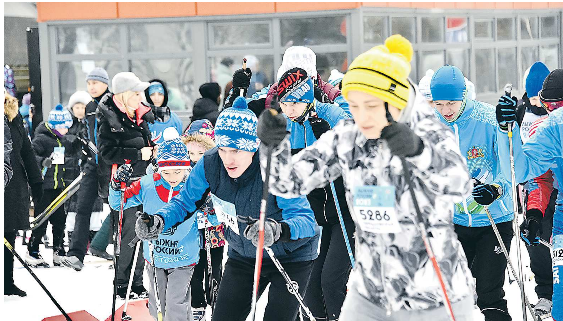
Конкурс помогает дать путевку в жизнь проектам, призванным популяризовать здоровый образ жизни среди россиян