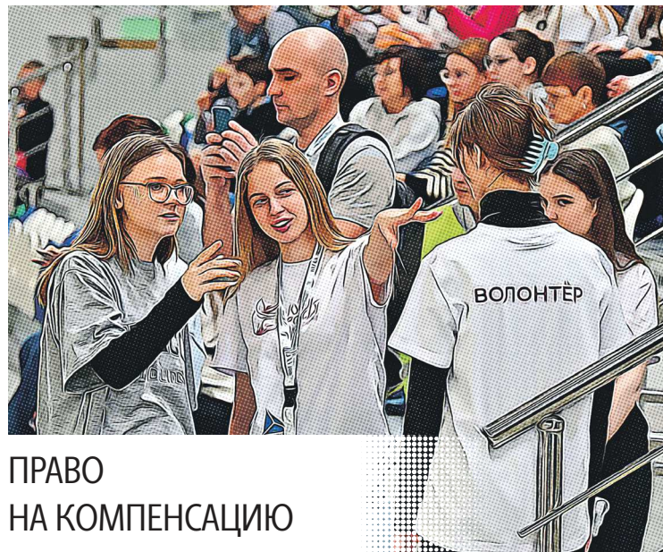
ПРАВО НА КОМПЕНСАЦИЮ