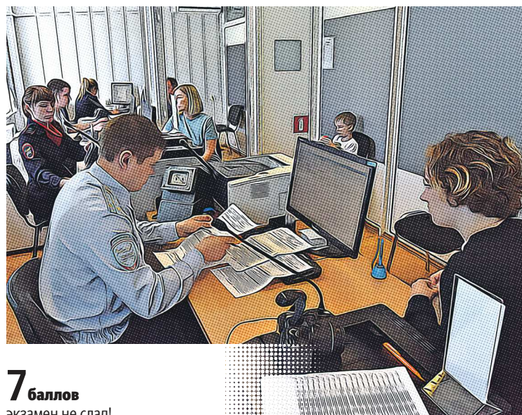
7 баллов экзамен не сдал!

Однако есть и хорошая новость: можно будет сделать больше ошибок на экзамене в ГИБДД. Новые правила подразумевают увеличение разрешенных штрафных баллов (с пяти до семи), при наборе которых кандидату выставляется оценка «не сдал».