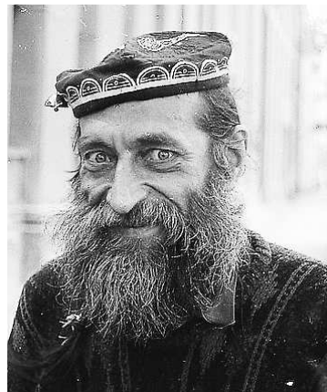
Фотограф Евгений Малахин , Свердловск

больше свобод фотография получила в любительских клубах, где собирался узкий круг единомышленников. Они в числе прочего проводили эксперименты над пленкой, пытались добиться интересных визуальных эффектов, но при этом лишь единицы последовательно использовали эти опыты в творческой практике. Им-то, редким мастерам из Ленинграда и Свердловска, посвящена открывшаяся выставка.