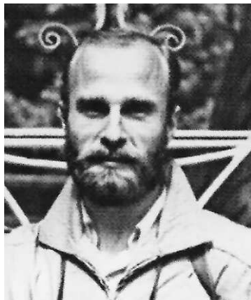
Фотограф Геннадий Приходько , Ленинград

В 1960-1970-е годы фотография официально носила документальный, репортажный характер и не воспринималась как вид изобразительного искусства. Она служила зеркалом действительности – инструментом, запечатляющим исторические события. И часто попытки фотографов выйти за эти рамки подвергались жесткой цензуре. Гораздо