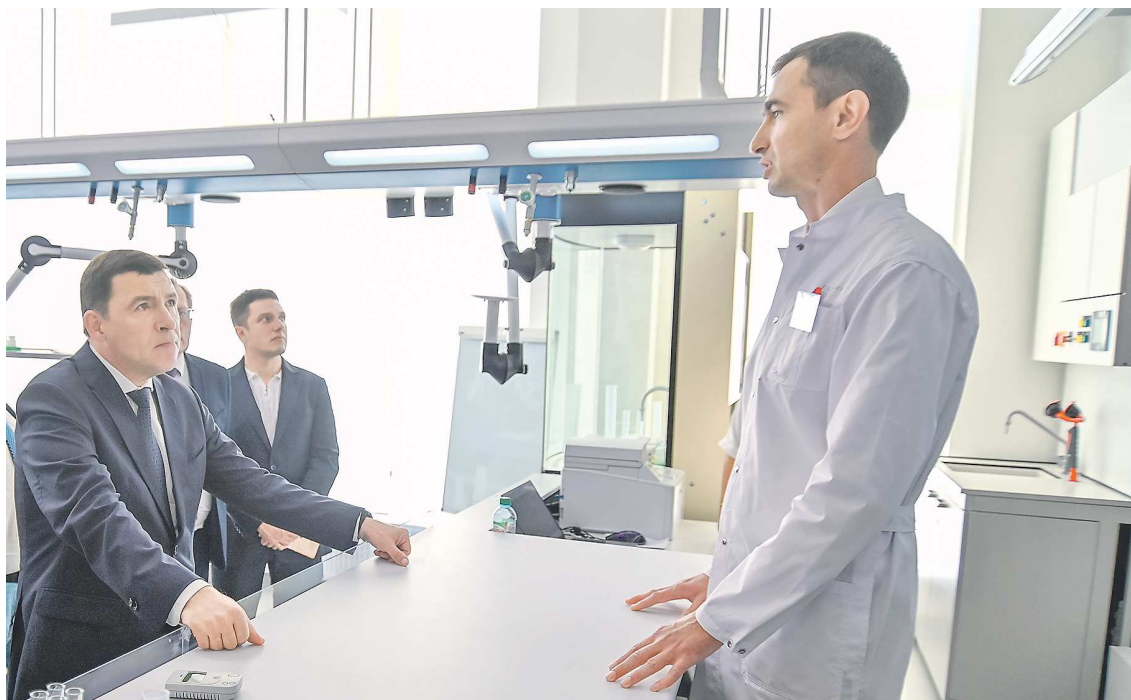
Губернатор оценил оснащение кабинета химии, в котором уже на следующей неделе будут учиться ребята из классов естественнонаучного профиля

Губернатор отметил, что в числе главных задач работников образования – формирование единого воспитательного и образовательного пространства. Для этого необходимо применять современные педагогические практики, укреплять взаимодействие с родительским сообществом, совершенствовать подходы в вос-