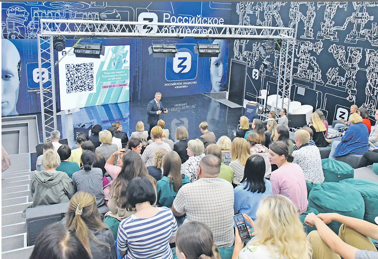
Подписание состоялось на площадке Российского общества «Знание» в ходе августовского совещания педагогов региона