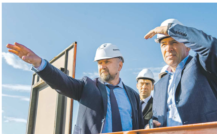
В ходе рабочей поездки Евгений Куйвашев осмотрел месторождение «Волковское» недалеко от Кушвы, где планируется масштабное строительство

– Сегодня мы рассматриваем вопросы социально-экономического развития Кушвинского городского округа, а также городских округов Верхняя Тура и Красноуральск. Все они близко расположены друг к другу, имеют крепкие межмуниципальные связи, а главное – схожую структуру эконо-