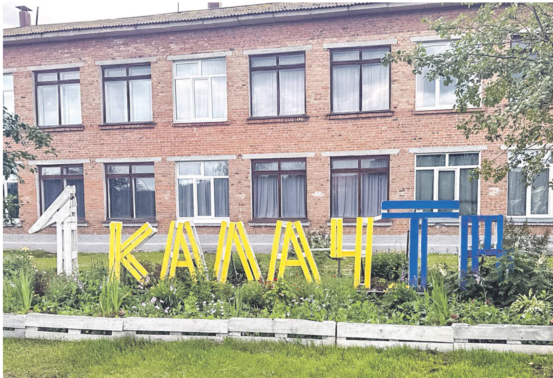
Какая еще школа сможет похвастаться такой инсталляцией

В 2022 году мы стали победителями заочного этапа Все-