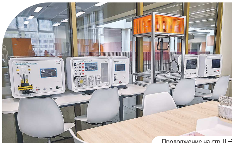
Продолжение на стр. II →