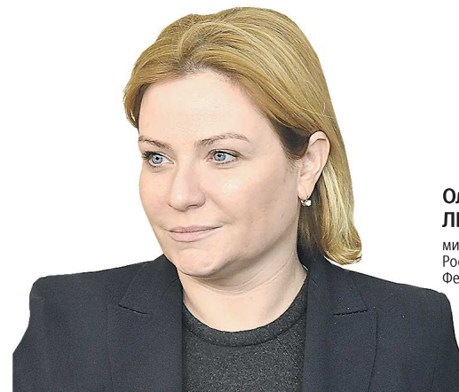
Ольга ЛЮБИМОВА, министр культуры Российской Федерации

ПРЕДСТАВЛЕНО СТУДЕНЧЕСКОЙ МОДЕЛЬНОЙ БИБЛИОТЕКОЙ