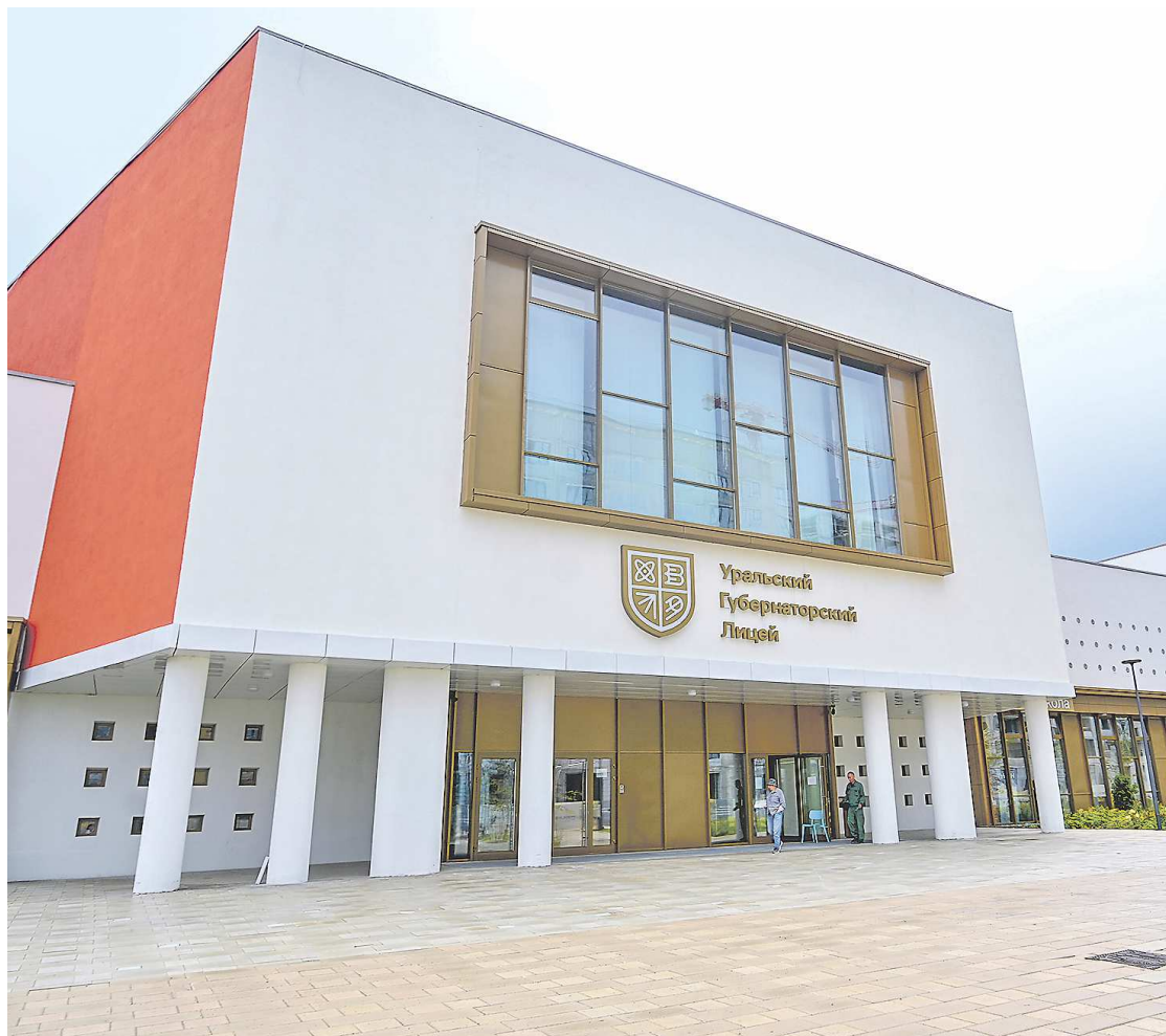
Губернаторский лицей в микрорайоне Солнечный в этом году впервые примет учеников

— В этом году за школьные парты сядут почти 570 тыс. учеников, в том числе свыше 50 тыс. первоклассников. По программам среднего профессионального образования в колледжах и техникумах будут обучаться 125 тыс. студентов. Проведена большая подготовительная работа. В новом учебном году в Екатеринбурге открываются три новые школы, еще два школьных здания капитально отремонтированы. До конца 2024 года необходимо завершить ремонт еще на 14 объектах. Прошу минобразования держать на контроле сроки и качество выполнения ремонтных работ, а также вопросы обеспечения комплексной безопасности учащихся и педагогов, — заявил Евгений Куйвашев.