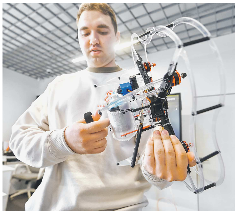
Преподаватель направления «Аэроквантум» в Верхней Пышме демонстрирует дрон для покраски стен