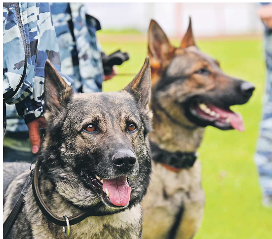
Самая распространенная порода собак в кинологических службах – немецкая овчарка, обладающая отличным чутьем и хорошо поддающаяся дрессировке