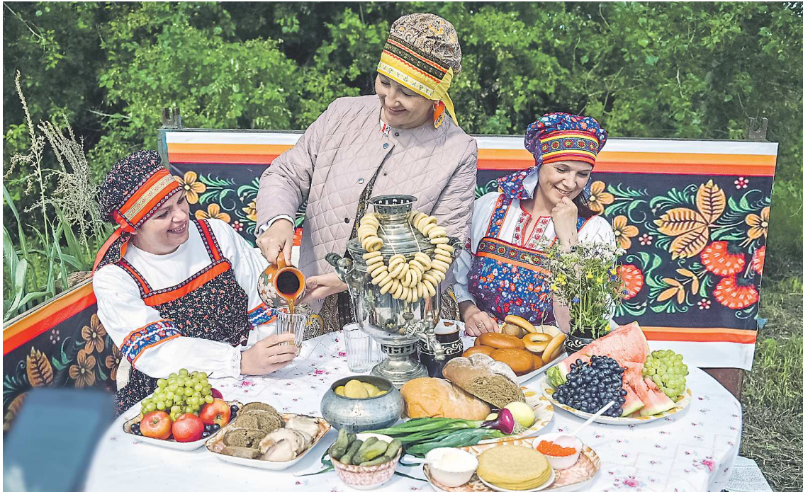
«Селянки» из краеведческого музея Сухого Лога задают настроение «Дня поля»