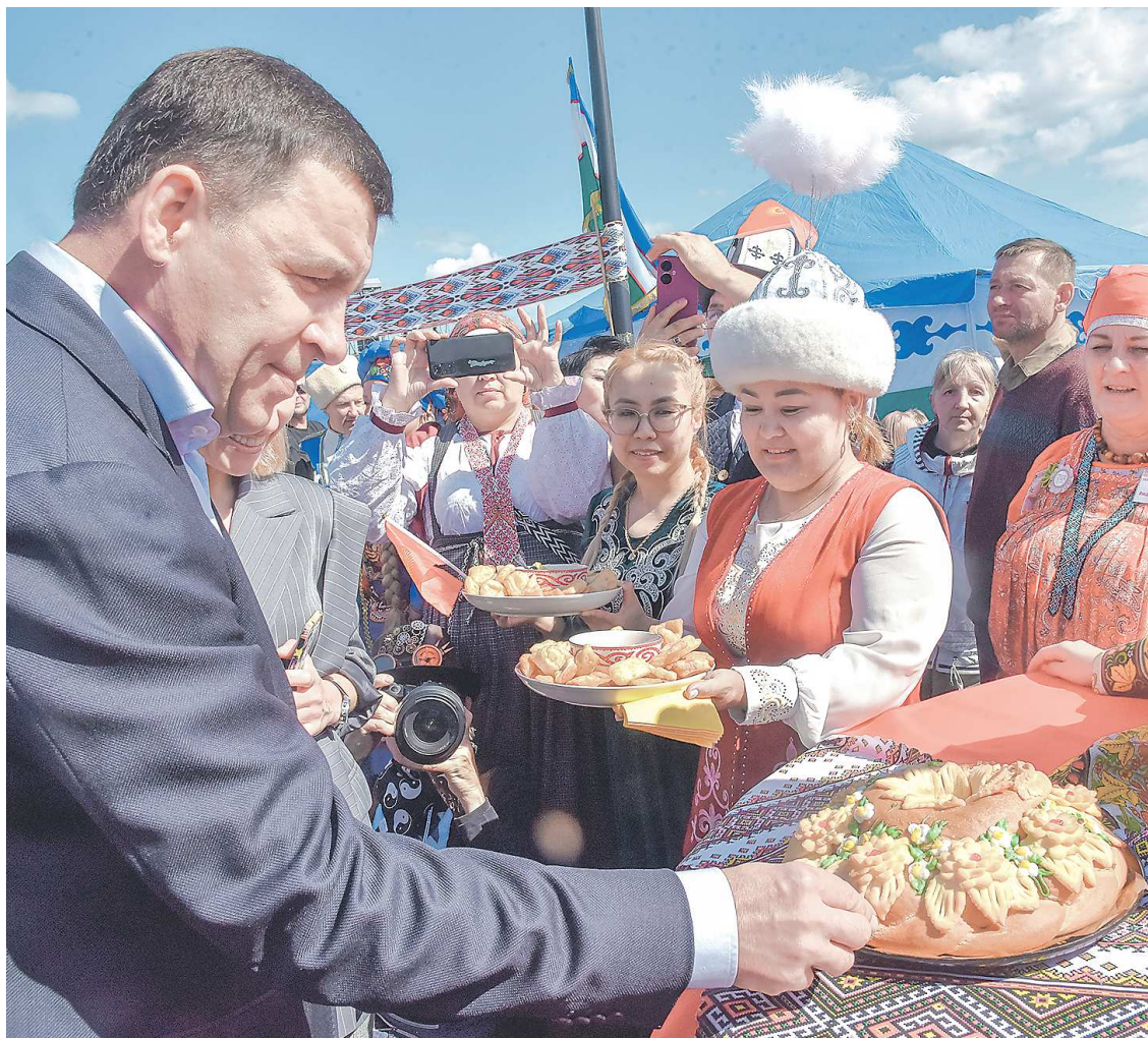
Рядом с шатрами национального подворья на Ирбитской ярмарке губернатора Евгения Куйвашева ждали с блюдами традиционной кухни разных народов