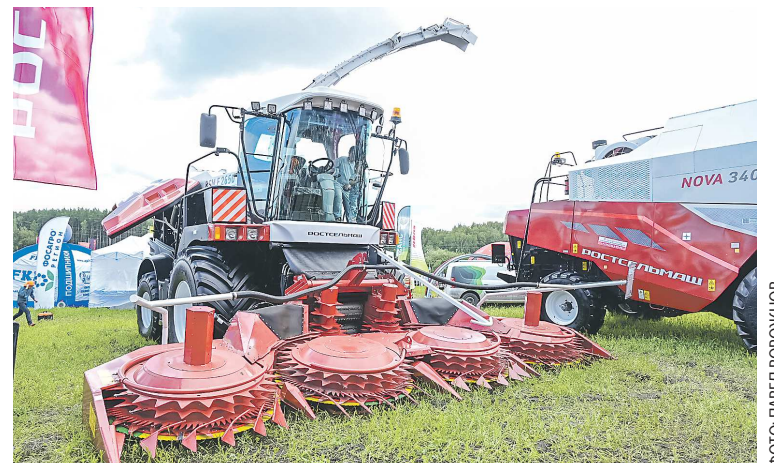
Более 2,5 миллиарда рублей направили аграрии Свердловской области на приобретение сельхозтехники в 2024 году