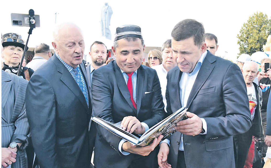
Во время обхода губернатор Евгений Куйвашев вместе с Эдуардом Росселем, в бытность которого главой региона и возродилась Ирбитская ярмарка, встретились в «Чайном квартале» с представителями Таджикистана

– Конечно, ярмарка растет и развивается. Вы заметили, что с каждым годом она занимает все больше места? Сейчас даже идет разговор об откры-