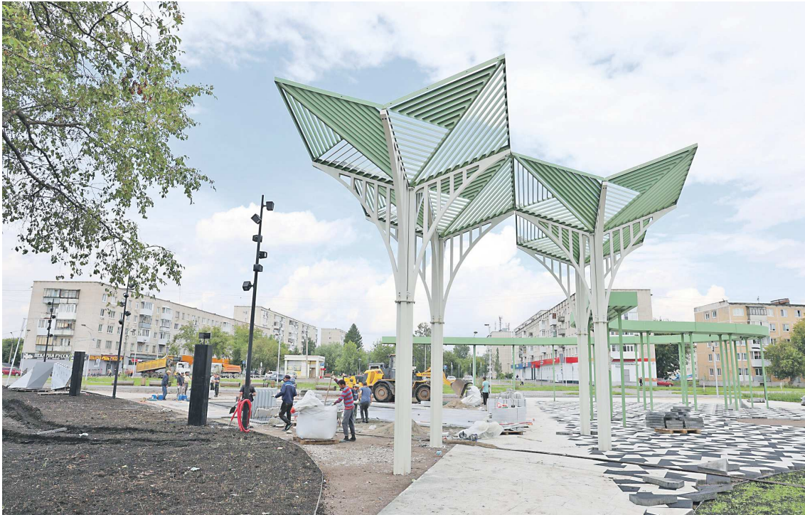
ПРЕСС-СЛУЖБА АДМИНИСТРАЦИИ КАМЕНСК-УРАЛЬСКОГО ГО