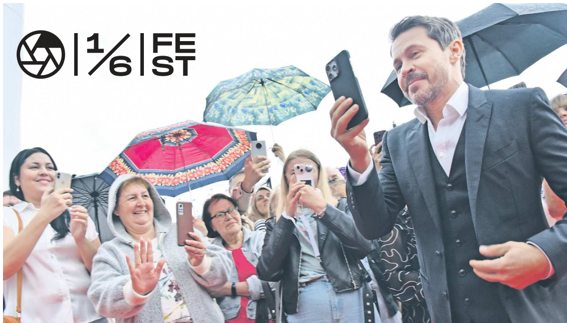
На красной дорожке «Одной шестой» – Павел Деревянко, он сыграл одну из ключевых ролей в фильме Свердловской киностудии