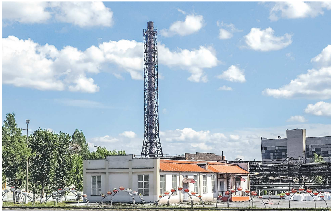
Инвестиционный проект на «Хромпике» планируется реализовать в 2024 – 2028 годах

– Статус участника приоритетного инвестпроекта позволяет предприятию применять льготы по налогу на имущество, пониженную ставку по налогу на прибыль, а с 2025 года – инве-