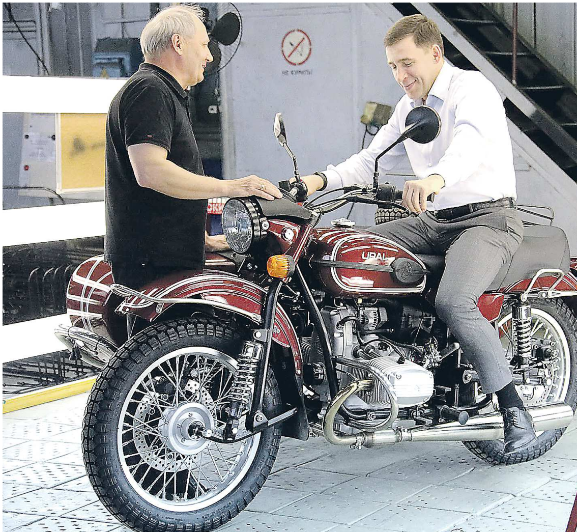
Надежность легендарных мотоциклов «Урал», которые могут получить участники викторины, оценил губернатор Евгений Куйвашев во время одного из своих визитов в Ирбит