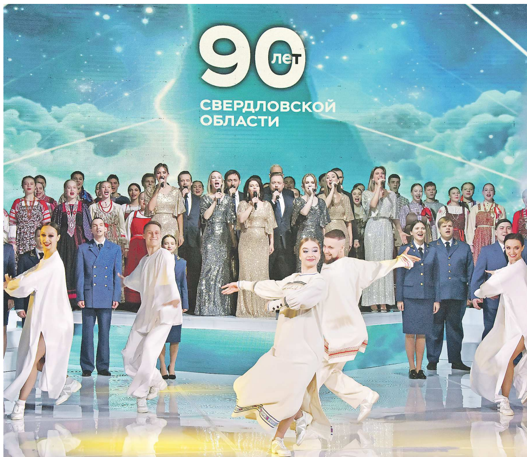
Праздничная программа стартовала с торжественного собрания в Театре эстрады, на котором выступили творческие коллективы Среднего Урала