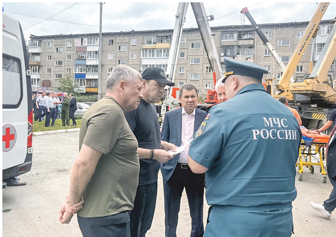
ДЕПАРТАМЕНТ ИНФОРМАТИКИ СВЕРДЛОВСКОЙ ОБЛАСТИ