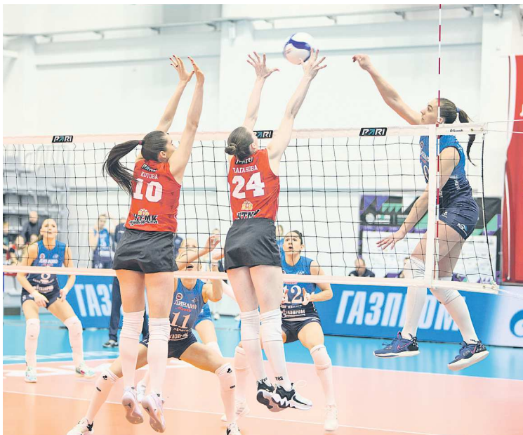
«Уралочка» и московское «Динамо» встретятся в первом матче Кубка легенд. В прошлом сезоне команды играли между собой в 1/4 финала

Предварительный этап пройдет в формате «каждый с каждым», команды сыграют в два круга. Интересно, что группа «Уралочки» первые матчи проведет в екатеринбургском ДИВСе. Так, 26 августа в 15:30 встретятся «Динамо-Метар» и «Динамо-Ак Барс», в 18:30 – московское «Динамо» и «Уралочка», 27 августа в 15:30 – «Динамо-Ак Барс» и московское «Динамо», а в 18:30 – «Уралочка» и «Динамо-Метар»,