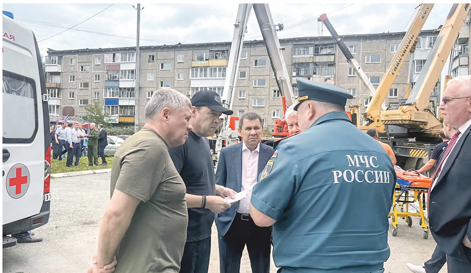
ДЕПАРТАМЕНТ ИНФОРМАТИКИ СВЕРДЛОВСКОЙ ОБЛАСТИ

Органы региональной и местной власти, все службы и ведомства отреагировали на чрезвычайную ситуацию оперативно. С 12:30 на территории Дзержинского района ввели режим чрезвычайной ситуации. Сотрудники МЧС России начали поисково-спасательные работы с использованием спецтехники на месте разрушения. В гостинице «Спортивная-1» Уралвагонзавода по улице Юности, 49 был развернут временный пункт размещения, здесь же организовали круглосуточный сбор помощи. Резервный пункт был подготовлен в гостинице «Спортивная-2».