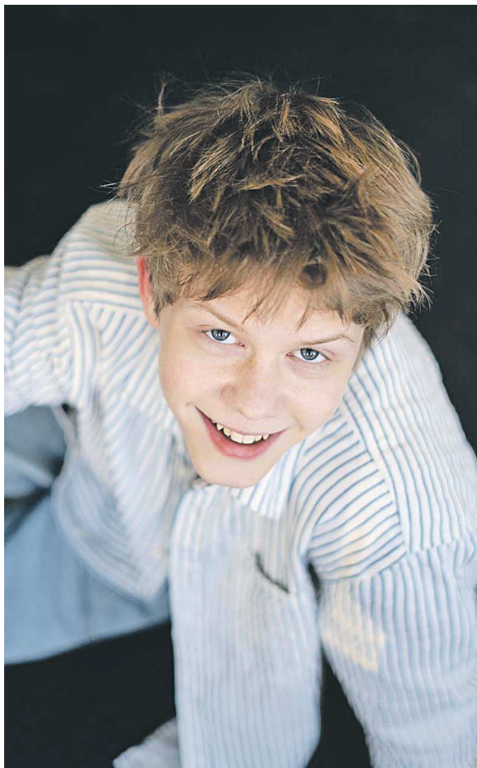
ИЗ АРХИВА ОНЛАЙН-КИНОТЕАТРА PREMIER

– Без зрителя не существует кино. И обратная связь – это безумно важно. Я не актер театра, поэтому не ощущаю зрительскую энергию в моменте. Это происходит потом благодаря подобным фестивалям. Недавно ко мне в Москву на пару дней приехали ребята из Казани – погуляли со мной, вручили небольшие подарочки. Было интересно и уютно. Осознание того, сколько они потратили сил ради поездки, повышает важность этой