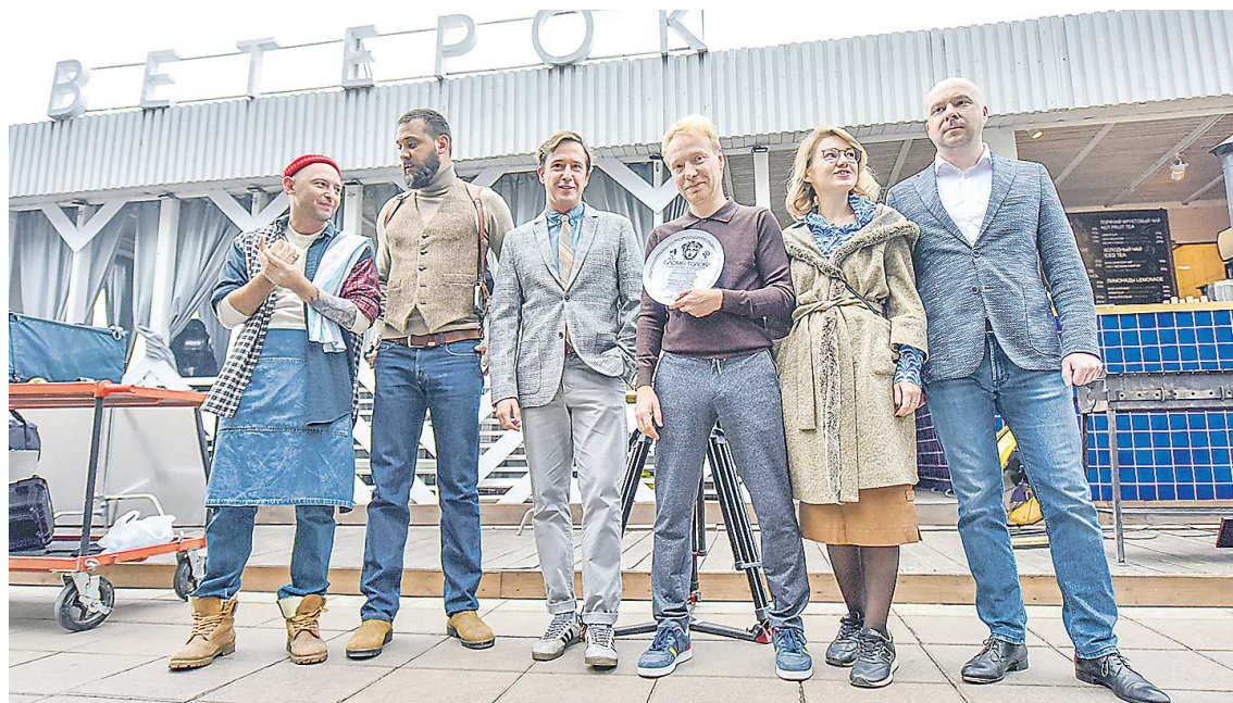
Команда фильма «Слома голову» в первый съемочный день. А уже совсем скоро свердловчане смогут увидеть результат

Теперь о фильме открытия. Это криминальная трагикомедия – именно так создатели определяют жанр картины. В центре сюжета которой история преподавателя античной литературы, семьянина и конформиста, жизнь которого меняется за не-