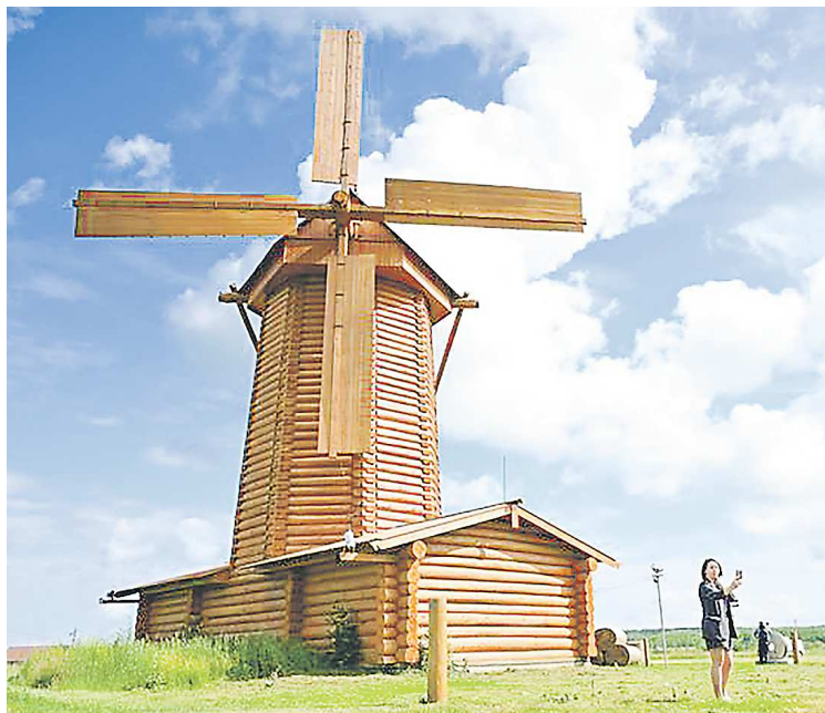
Мельница, построенная по технологиям XVI века, является частью туристической инфраструктуры

данской областей. Помимо семьи на ферме трудятся порядка 30 сотрудников, это как сыродельцы, так и работники фермы. В основном здесь работают местные жители, но не так давно к коллективу присоединились супруги, которые приехали из Казахстана.