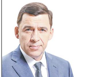
Губернатор Свердловской области