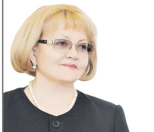
Председатель Законодательного Собрания Свердловской области