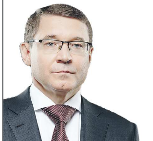
Полномочный представитель Президента России в Уральском федеральном округе

Пусть ваша жизнь будет «крепким сплавом» из счастья, любви и благополучия! Желаю вам и вашим семьям крепкого здоровья и всего самого наилучшего!