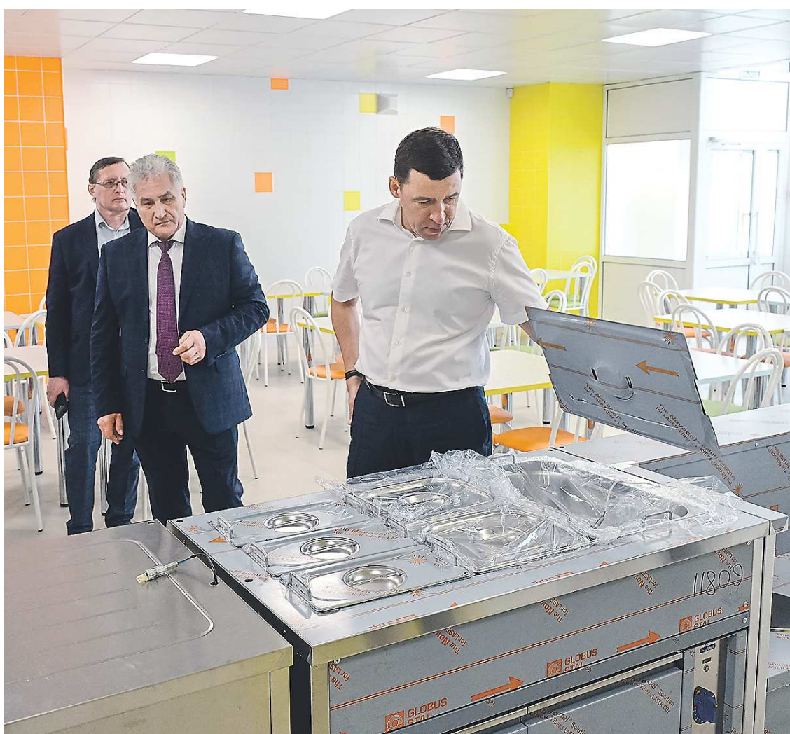
Губернатор Евгений Куйвашев уделяет особое внимание качеству выполняемых работ на объектах социальной инфраструктуры. На фото глава региона осматривает открытую после капитального ремонта школу №48 в Нижнем Тагиле