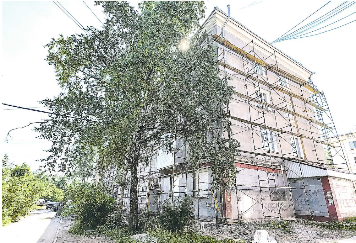
Июль, август – «горячая» пора капитального ремонта домов в Свердловской области

В рамках ремонта фасада полностью заменили три балкона: плиты, ограждения и лепнину. Рабочие также восстанавливают оконные проемы, красят окна (если они деревянные), меняют оконные отливы – все это