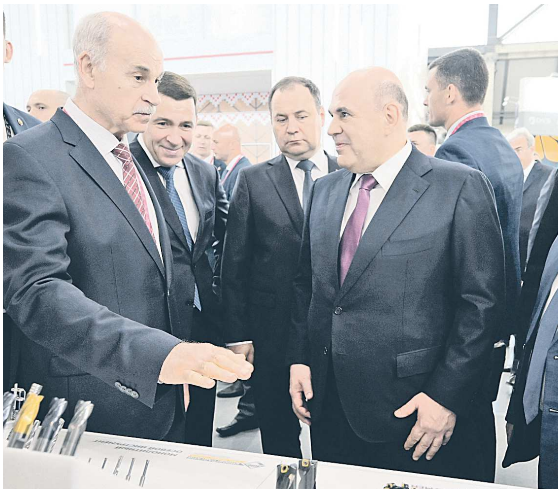
Вниманию премьер-министра была представлена уникальная продукция Кировградского завода твердых сплавов, востребованная и в промышленности, и в медицинской отрасли, и на предприятиях оборонного комплекса

Взаимный товарооборот между Россией и Эмиратами по итогам 2023 года достиг рекордного уровня, приблизившись к 1 трлн рублей. Михаил Мишустин поблагодарил представителей делегации ОАЭ за участие в ИННОПРОМ, что, по мнению