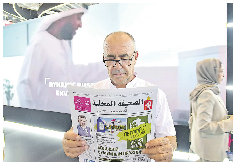
«Увидеть на Урале газету на родном языке – уже само по себе приятно»

– Такие важные заявления – это не мои полномочия (улыба-