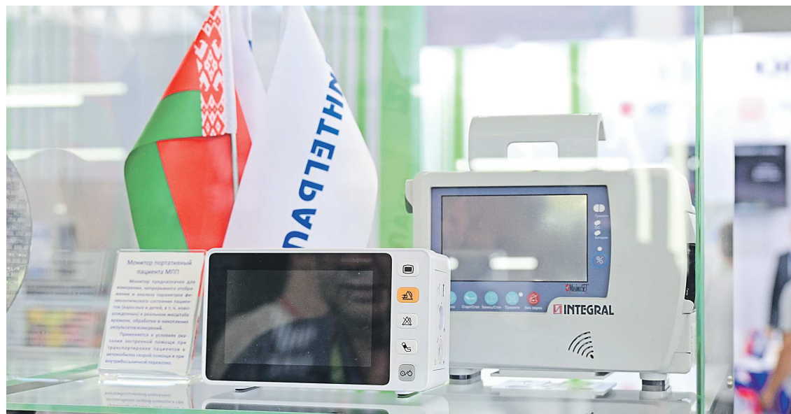
С 2020 года «Интеграл» начал выпуск медицинского оборудования – чтобы «не стоять с протянутой рукой» в случае новой волны COVID-19

– Для того, чтобы поставлять изделия для космических систем, мы проводим испытания на спецфакторы. Например, облучение тяжелыми частицами, ионное облучение. Чтобы пони-