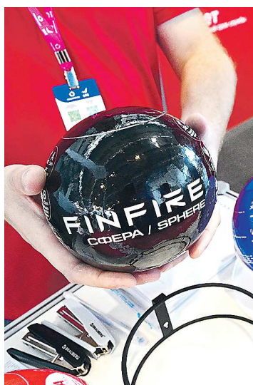
Такие огнетушители станут интересной деталью в интерьере