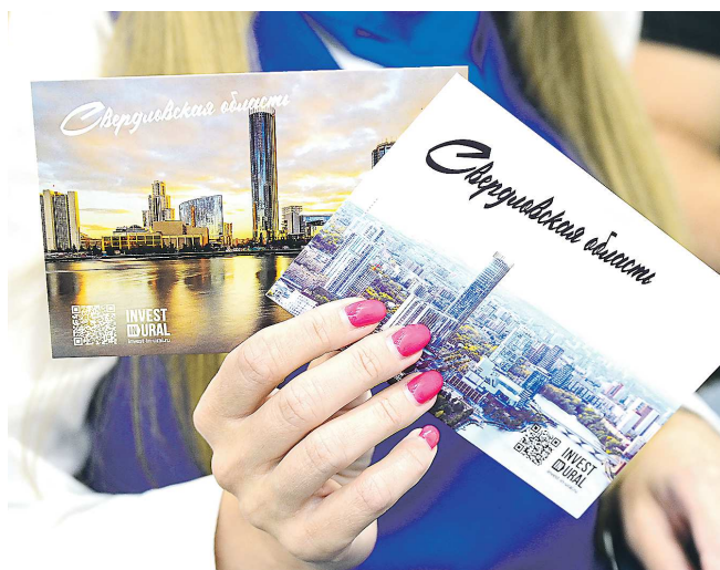
Каждый участник и посетитель ИННОПРОМ-2024 мог отправить родным и близким открытку с видами Екатеринбурга прямо на выставке