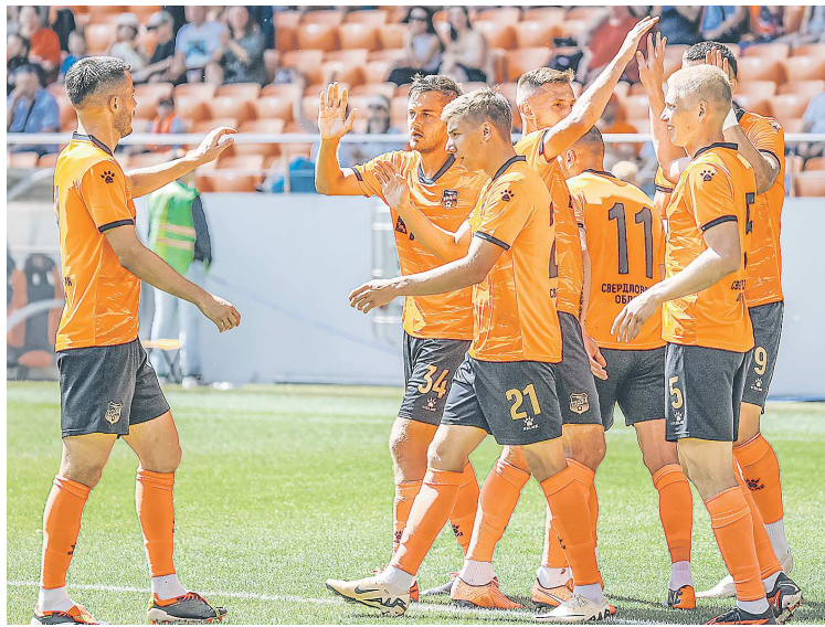
Вместо предсезонных матчей «Урал» принял участие в «Кубке ИННОПРОМ-2024». В полуфинале «шмели» разгромили «Равшан» (5:0), а вчера в финале сыграли с «Кызылкумом»