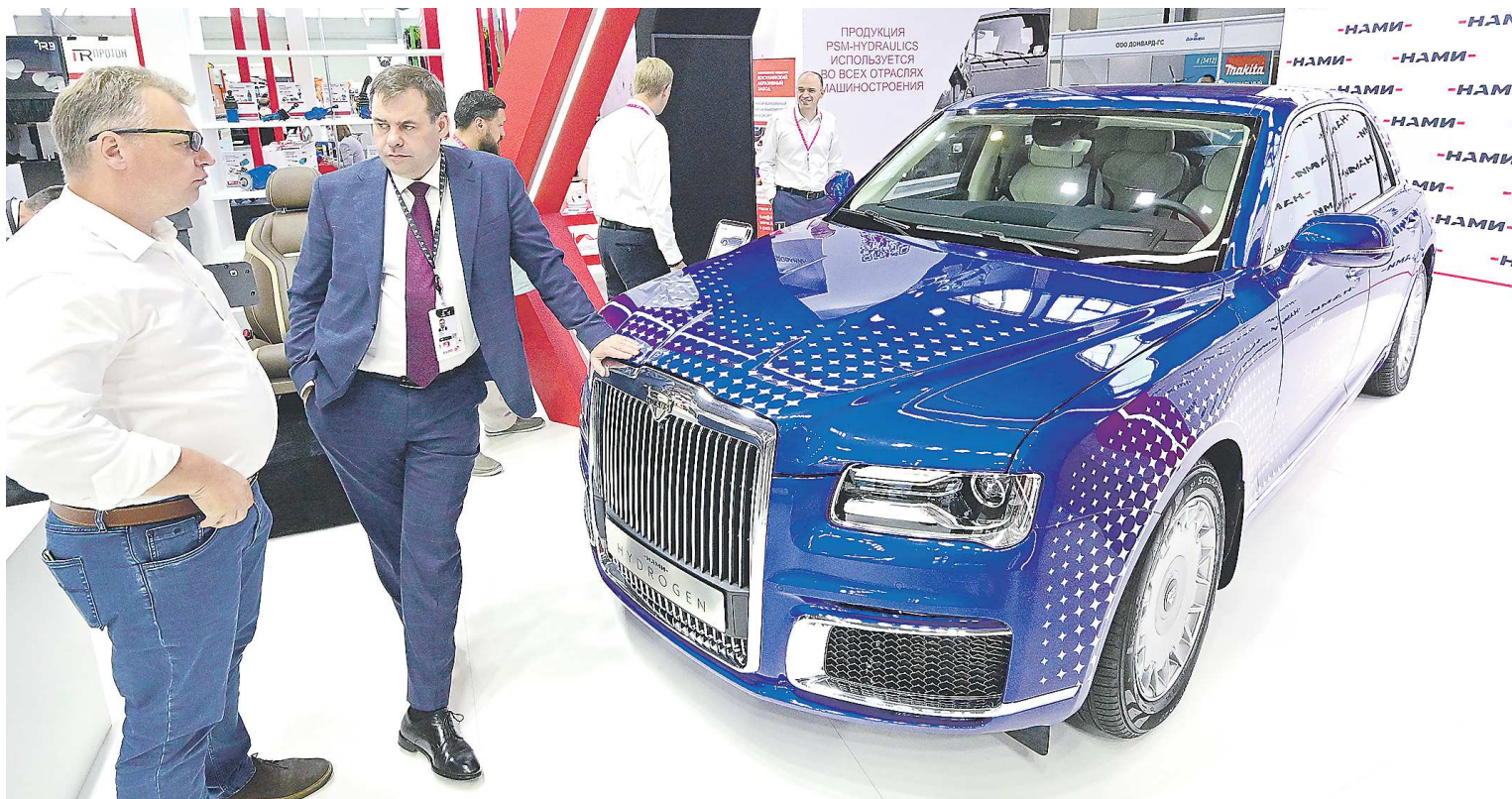
Уникальных Augus Senat было создано всего несколько штук

штабным, но не менее интересным разработкам российских ученых. Группа студентов, аспирантов и сотрудников Санкт-Петербургского политехнического университета Петра Великого представляла на ИННОПРОМ опытный образец робототехнической беспилотной платформы. Она способна убирать территории от снега, грязи и пыли. Два мощных электродвигателя позволяют платформе-беспилотнику перевозить на себе грузы массой до 150 кг и буксировать технику массой до 2 тонн.