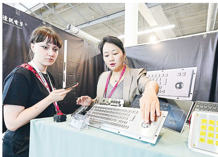
Этой клавиатуре не страшно, если вы на нее прольете кофе