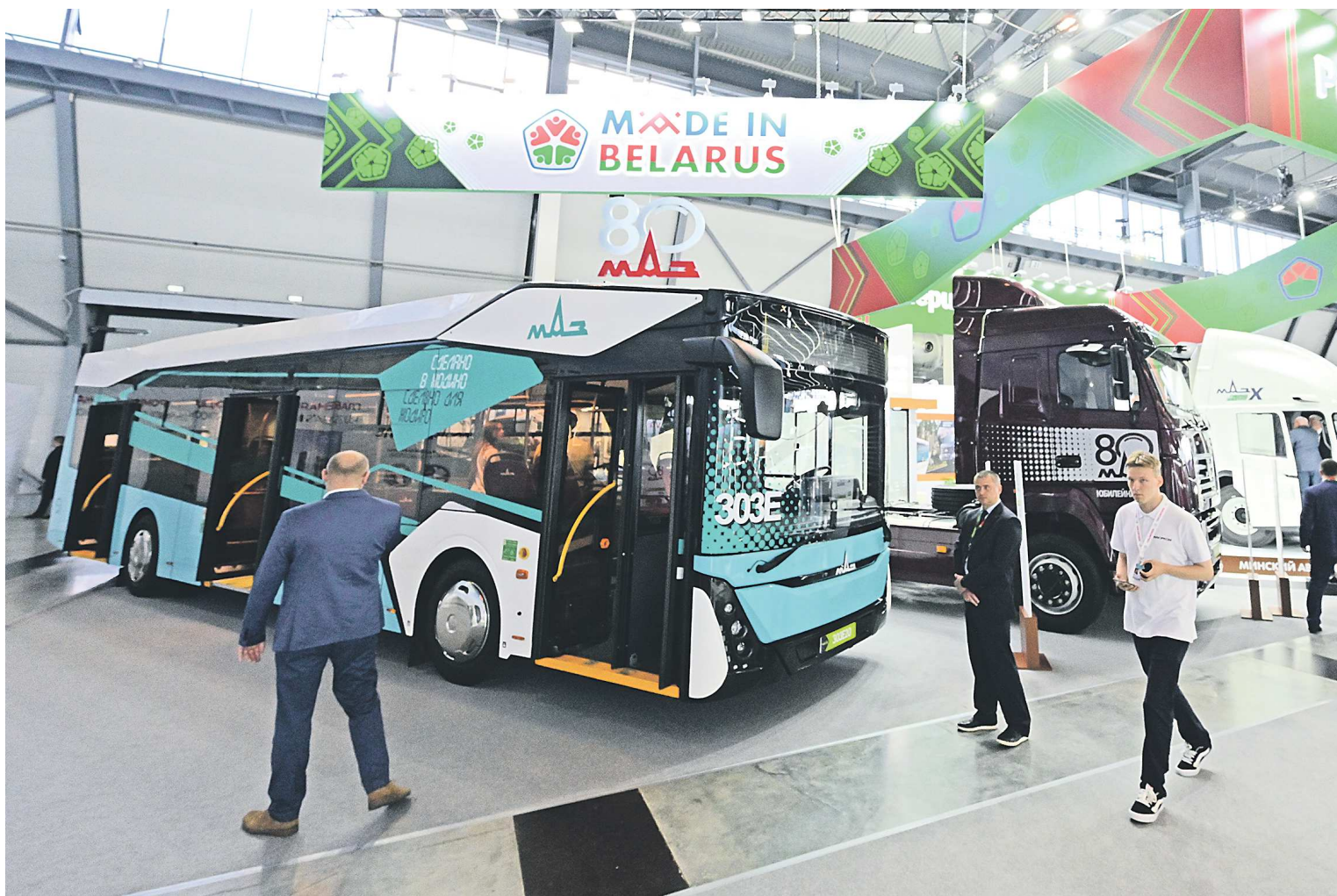
Электробус МАЗ-303 может проехать без подзарядки до 300 километров

Завод также производит седельные тягачи, самосвалы, бортовые автомобили, шасси, полноприводные автомобили, краны и мусоровозы. Как мы писали ранее, на ИННОПРОМ был представлен флагманский тягач, уникальный для постсоветского пространства. Это гибридная модель с дизельной установкой, которая приводит в работу генератор. Для привода используются два электродвигателя мощностью по 280 киловатт.