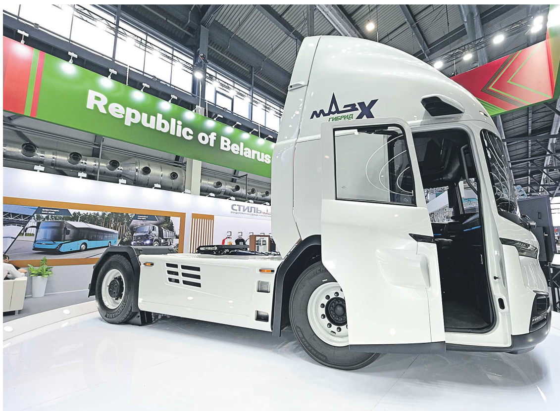
В 2027 году Минский автомобильный завод начнет серийное производство флагманского седельного тягача гибридного типа

Также есть накопительная батарея, на которой автомобиль может проехать до 50 километров. Очень полезная опция в городском пространстве, если нужно проехать от кольцевой дороги в центр.