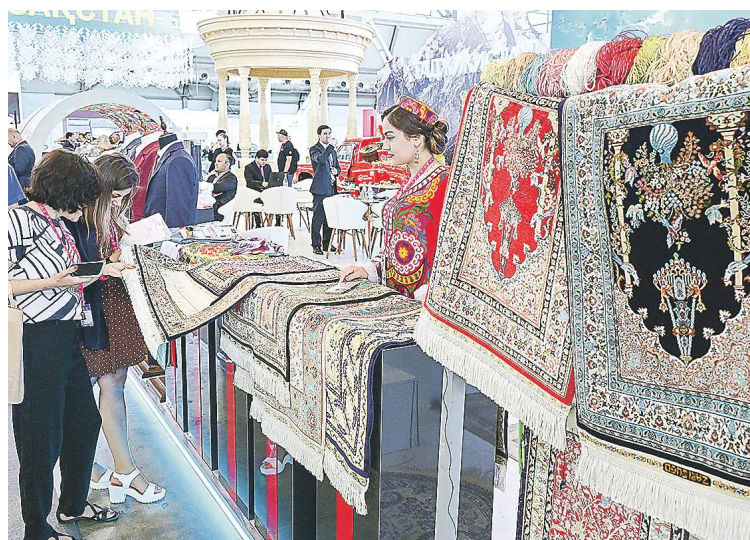
Традиционная часть экспозиции стран Востока – роскошные ковры