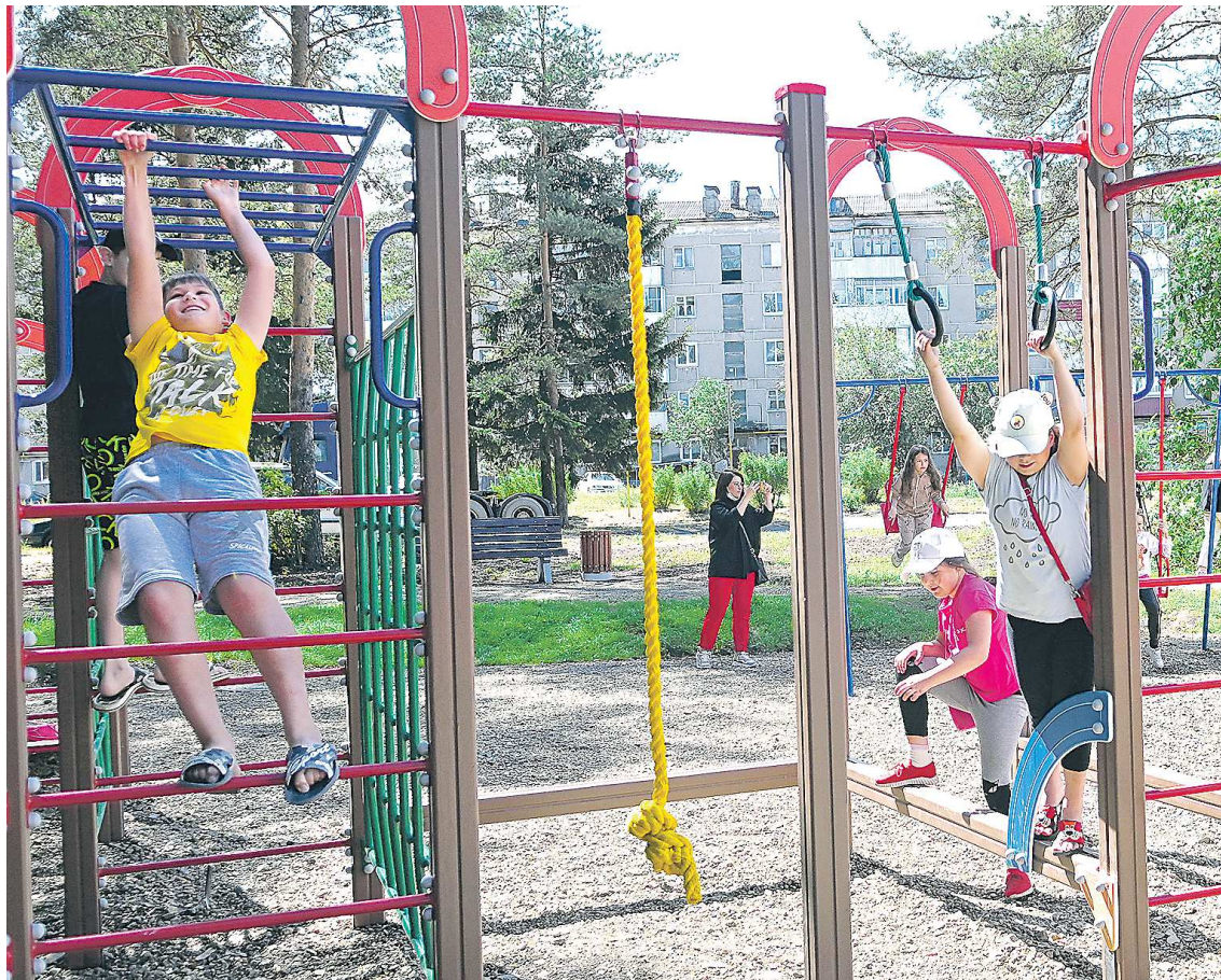
В муниципалитете регулярно благоустраивают парки и детские площадки, одним из последних прошло обновление парка имени Артёма в поселке Ис

Стадион станет первой спортивной площадкой подобного уровня в поселке, подобных объектов со стадионом, современным освещением еще