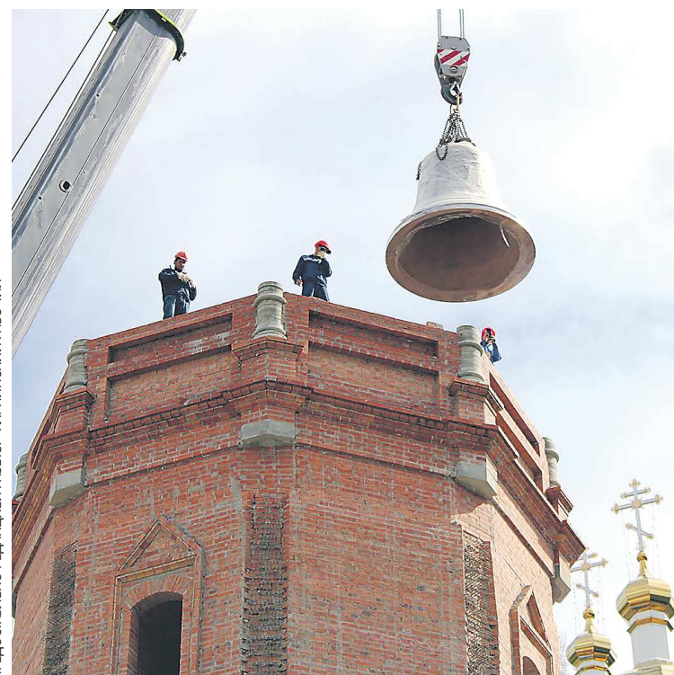
Возведение колокольни началось в прошлом году