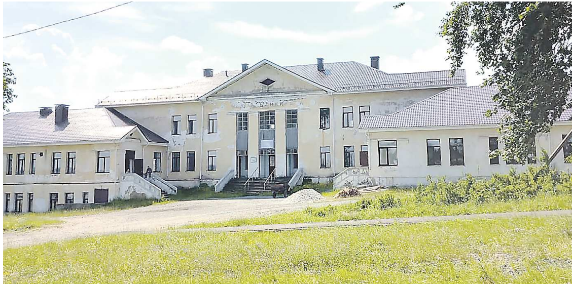
В поселке Полуночное бывшее здание больницы переоборудуют в Культурно-досуговый центр, работы уже идут

Решение о проведении капитального ремонта здания было принято губернатором региона во время визита в округ в 2018 году. Вопрос о появлении культурно-досугового центра