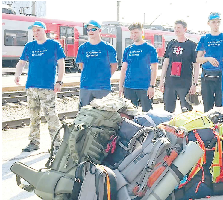
Волонтеры, которые отправились в экспедицию на перевал Дятлова, промаркируют отрезок протяженностью в 70 км

– Северный Урал всегда был привлекателен для туристов. Растет не только туристический поток, но и расширяется целевая аудитория: это не только люди, ведущие активный образ жизни, но и те, кто едут на север Урала с познавательными целями. Поэтому с прошлого года мы активно включились в развитие