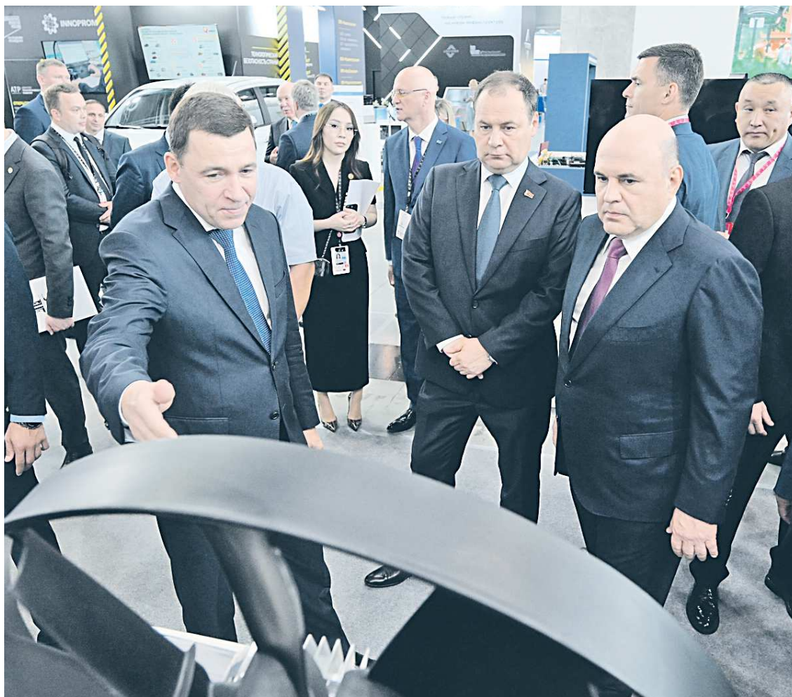
Стенд Свердловской области Михаилу Мишустину презентовал губернатор Евгений Куйвашев

Взаимный товарооборот между Россией и Эмиратами по итогам 2023 года достиг рекордного уровня, приблизившись к 1 трлн рублей. Михаил Мишустин поблагодарил представителей делегации ОАЭ за участие в ИННОПРОМ, что, по мнению