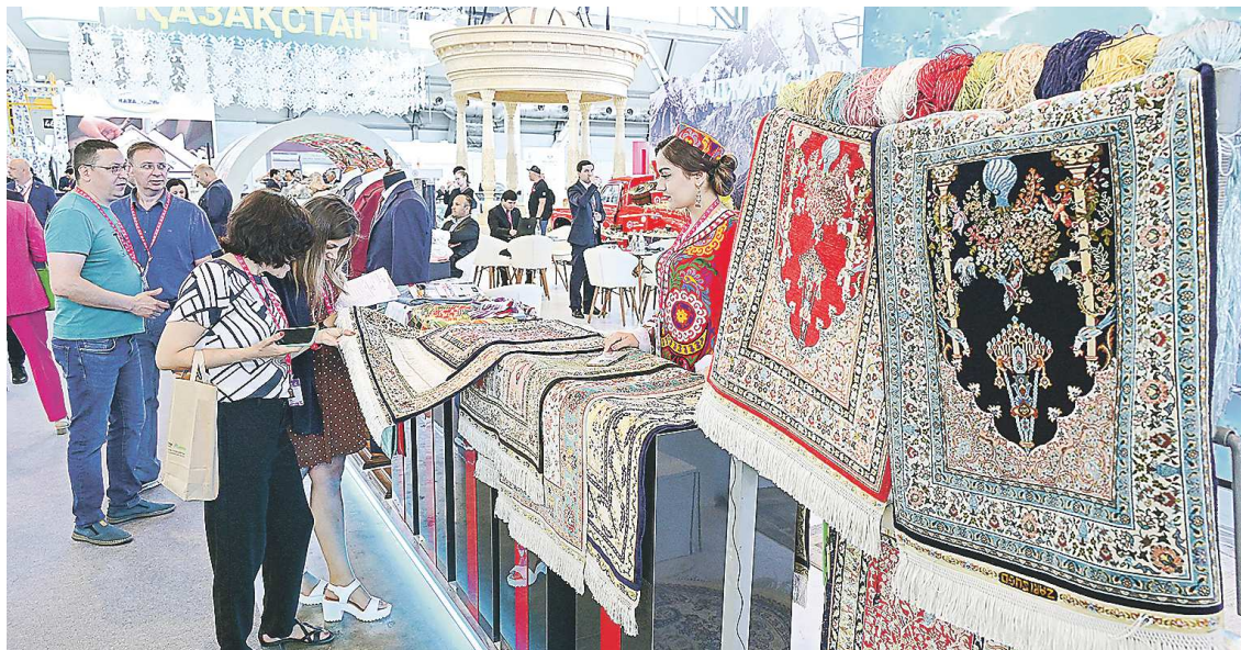
Традиционная часть экспозиции стран Востока – роскошные ковры