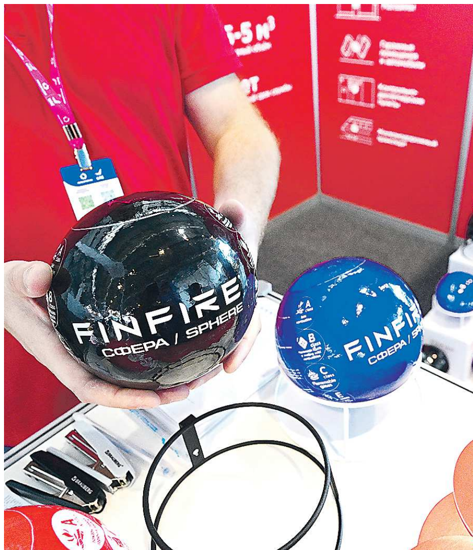
Такие огнетушители станут интересной деталью в интерьере