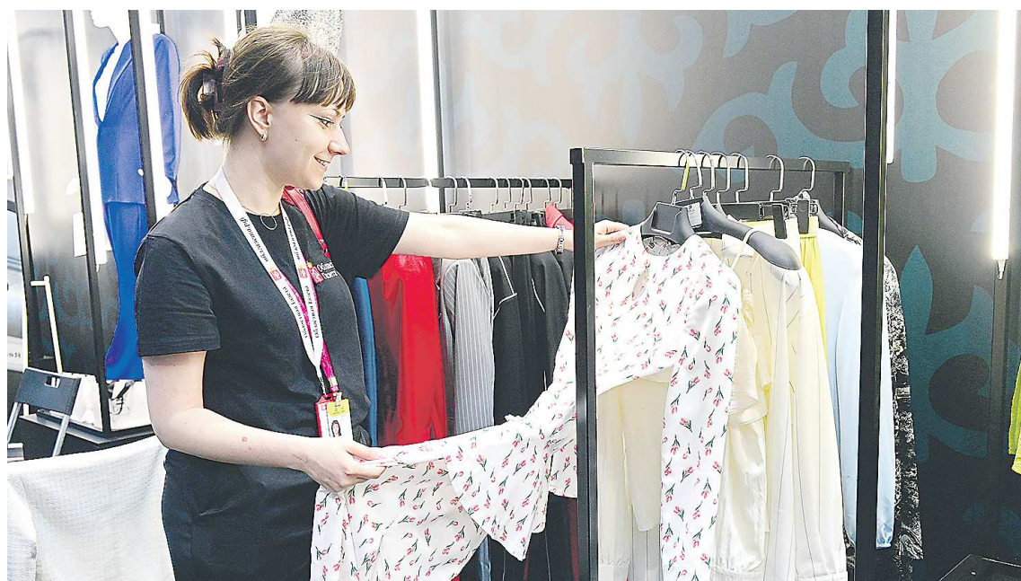
Любителям моды будет действительно интересно на стенде Узбекистана

Международная выставка ИННОПРОМ вышла на экватор. Позади два дня, впереди столько же. Завтра, в завершающий день, осмотреть экспозиции, где во всей красе представлены практические достижения самой передовой промышленной и научно-технической мысли России и дружественных стран, смогут все желающие. Свой собственный рейтинг самого интересного на ИННОПРОМ-2024 составили посетившие выставку накануне корреспонденты «ОГ» Алена КУРОЧКИНА и Павел ВОРОЖЦОВ.