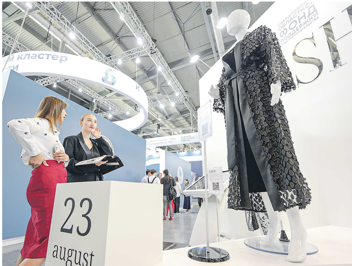
Стенд проекта U’FASHION на выставке ИННОПРОМ-2024 привлекает посетителей