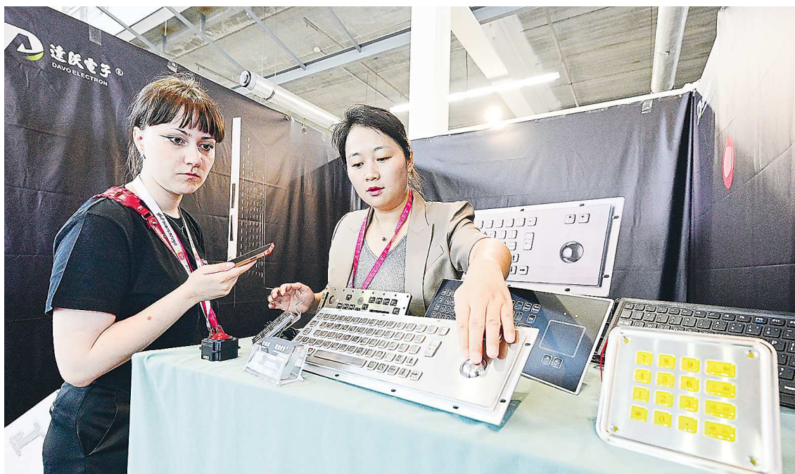
Этой клавиатуре не страшно, если вы на нее прольете кофе

На стенде Кыргызстана пробуем баурсак – некое круглое подобие пончиков, жаренных во фритюре, которые макаем в стеклянную тарелочку с теплым маслом. Вкусно. Уже только ради него стоило сюда приехать.