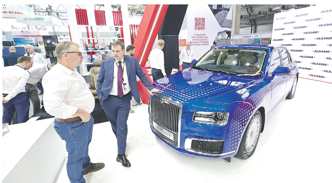
Уникальных Augus Senat было создано всего несколько штук

Что смотреть на ИННОПРОМ-2024 в день свободного посещения