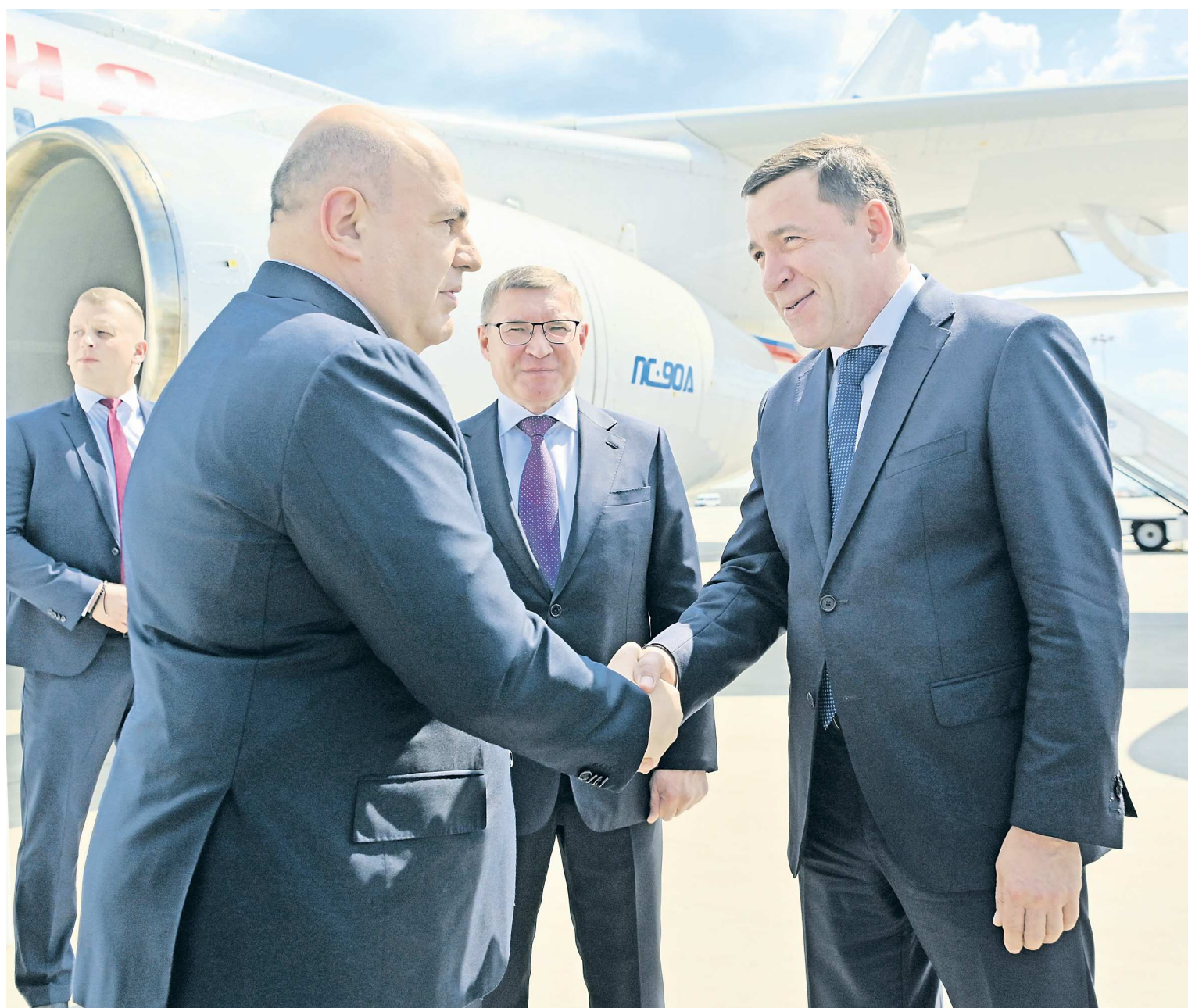
У трапа самолета российского премьер-министра Михаила Мишустина встречали губернатор Евгений Куйвашев и полпред Президента РФ в УрФО Владимир Якушев (в центре)

Председатель Правительства России Михаил Мишустин вместе с зарубежными коллегами принял участие в работе ИННОПРОМ-2024