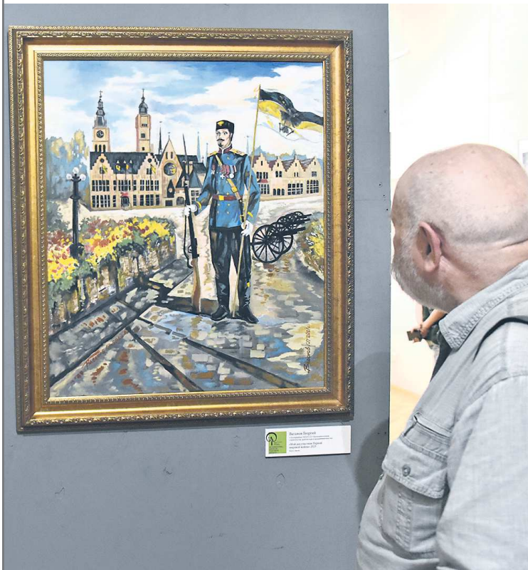
Картину «Мой дед – участник Первой мировой войны» нарисовал Георгий Ваганов (Уральский колледж строительства, архитектуры и предпринимательства)