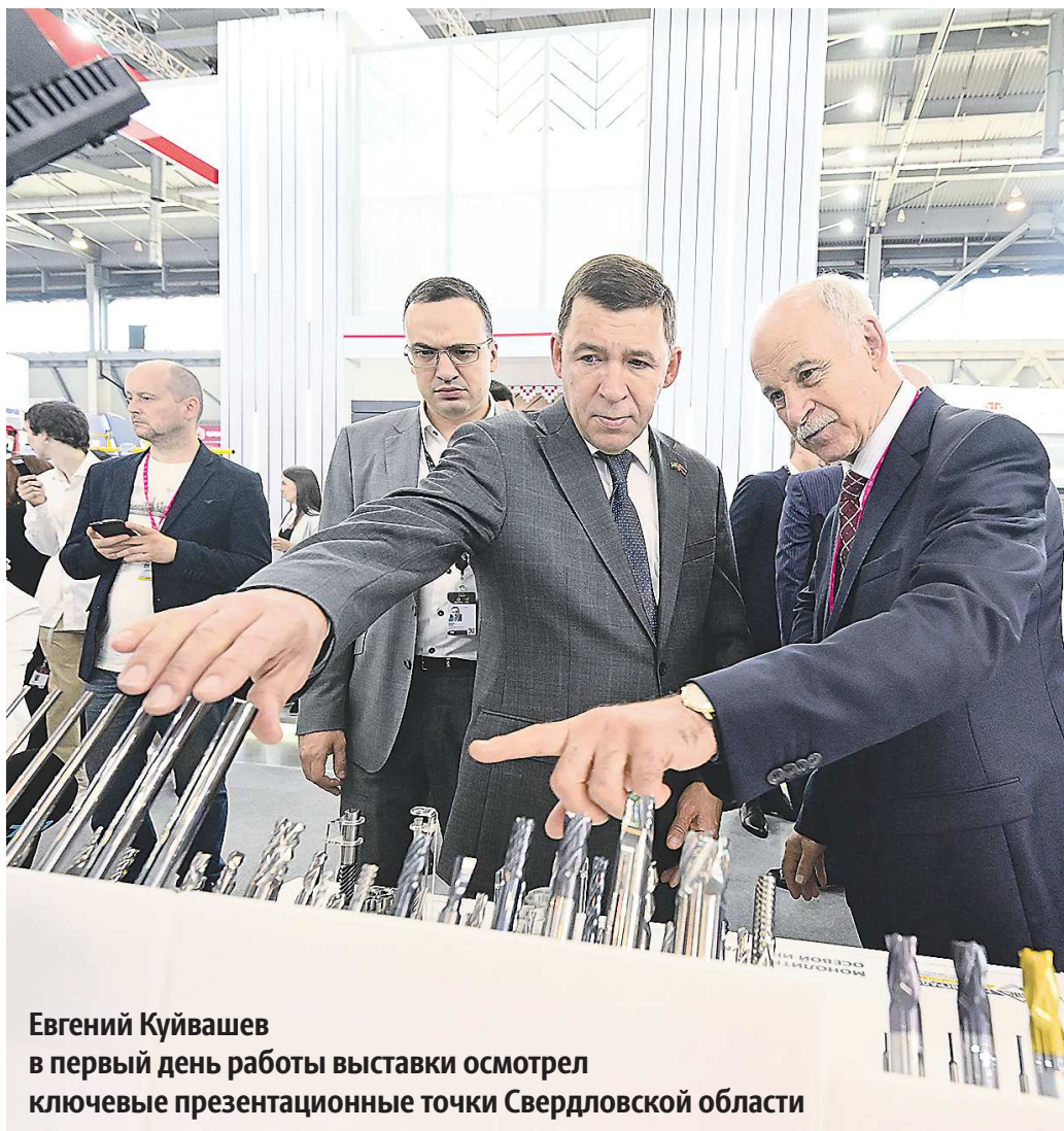
Евгений Куйвашев в первый день работы выставки осмотрел ключевые презентационные точки Свердловской области

Планируется, что за четыре дня на выставке пройдут порядка 48 мероприятий. В главной стратегической сессии «Технологическое партнерство: в центре внимания международного бизнеса», которая пройдет сегодня, примет участие председатель правительства России Михаил Мишустин и его коллеги из Белоруссии, Таджикистана и Киргизии. Также планируется подписание порядка 40 соглашений.