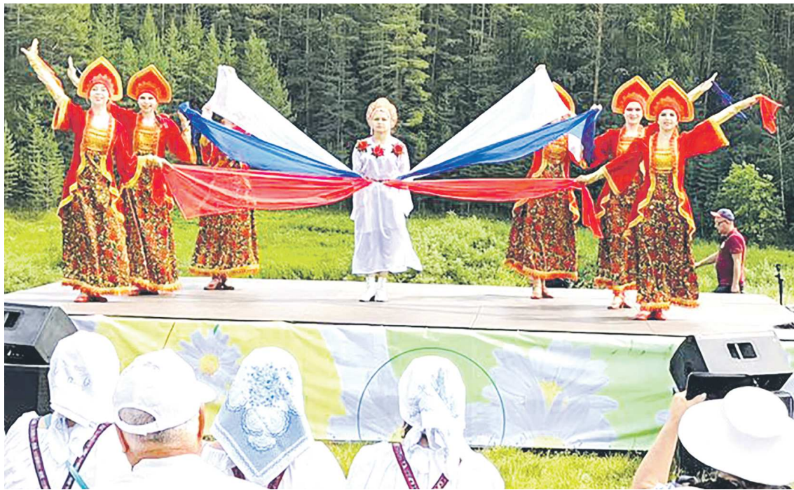
На «Кашинском хороводе» прошел конкурс хороводов, стилизованного и народного танца

Праздничную программу продолжила театрализованная свадьба в башкирских традициях. Перед гостями праздника вы-