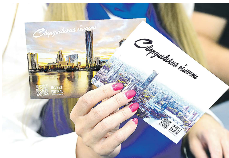
Каждый участник и посетитель ИННОПРОМ-2024 может отправить родным и близким открытку с видами Екатеринбурга прямо на выставке