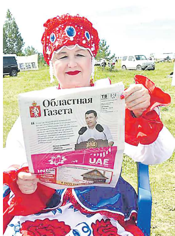
Гости «Кашинского хоровода» с удовольствием читают «Облгзету»