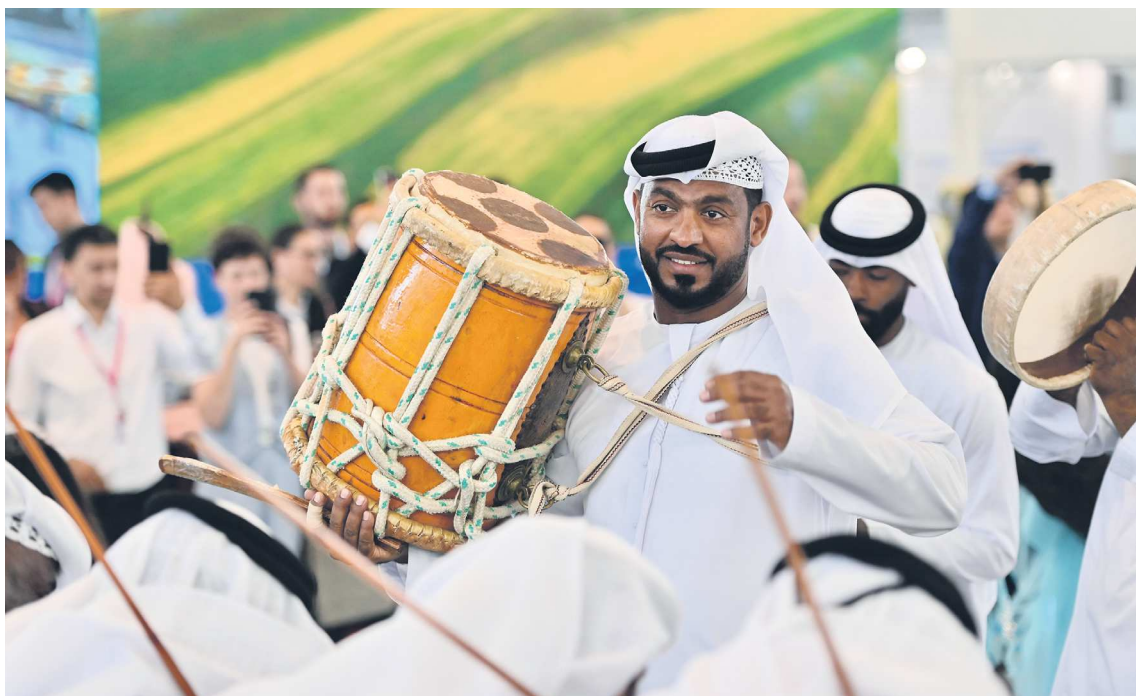
Далеко за пределами стенда слышны арабские песни и глухой стук продолговатого барабана – ранны