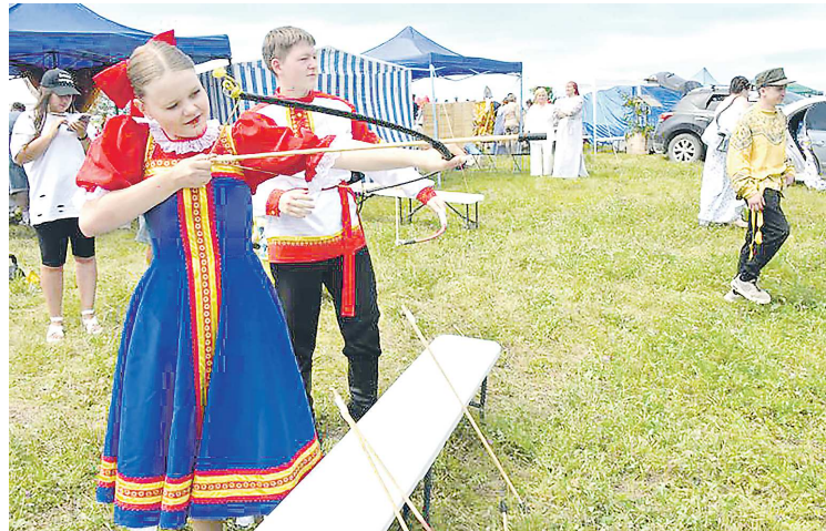
На народном гулянье гости могли принять участие в конкурсе стрелков из лука

ступил образцовый ансамбль башкирского и татарского фольклора «Кугарсен». В 7-минутной постановке артисты изобразили главные традиции и обряды народной свадьбы, исполнили национальные танцы, песни.