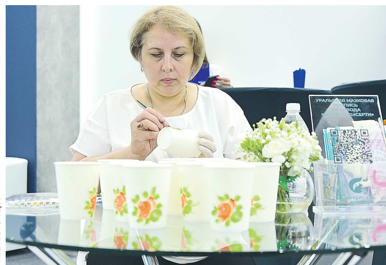
Стаканчики для лимонада в уютном кафе на стенде Свердловской области расписывает мастер завода «Сысертский фарфор»