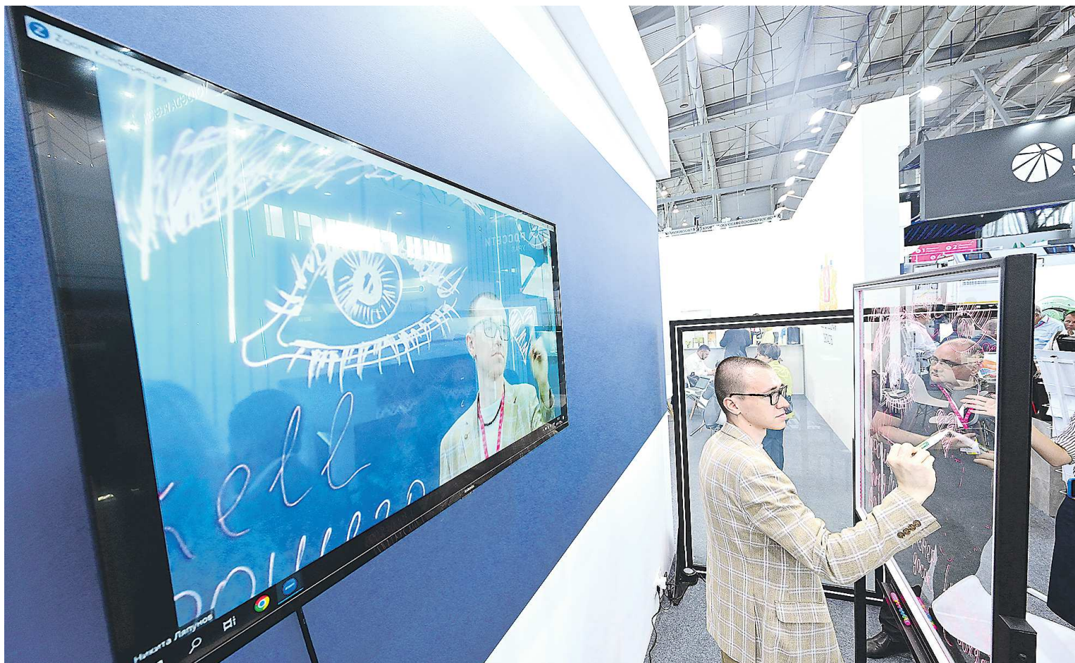
Прозрачные видеодоски компании «Аскел» подключаются к компьютеру, и все, что на них изображается, выводится на экран мониторов

Этот ларец взял гран-при на выставке в Дубае. Арабы назвали его «хранитель семейных тайн». Там есть тайная кнопка, при нажатии которой выдвигается ящик, куда вы можете сложить все са-