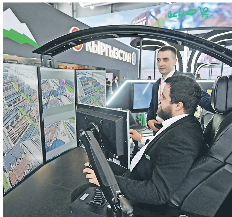
На стенде представлена инновационная система, которая позволяет удаленно наблюдать за безопасностью на предприятии